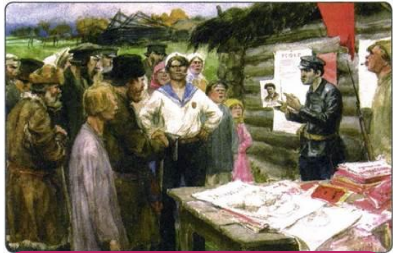
Митинг, собранный большевиками в деревне. Художник И. А. Владимиров. 1922 г.