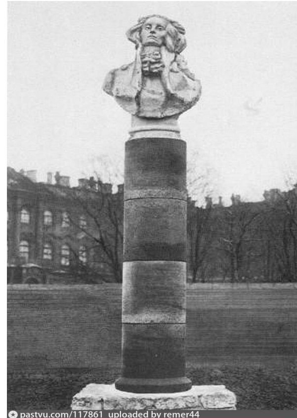
Памятник А. Радищеву, Петроград, 1918г., скульптор Л.В. Шервуд