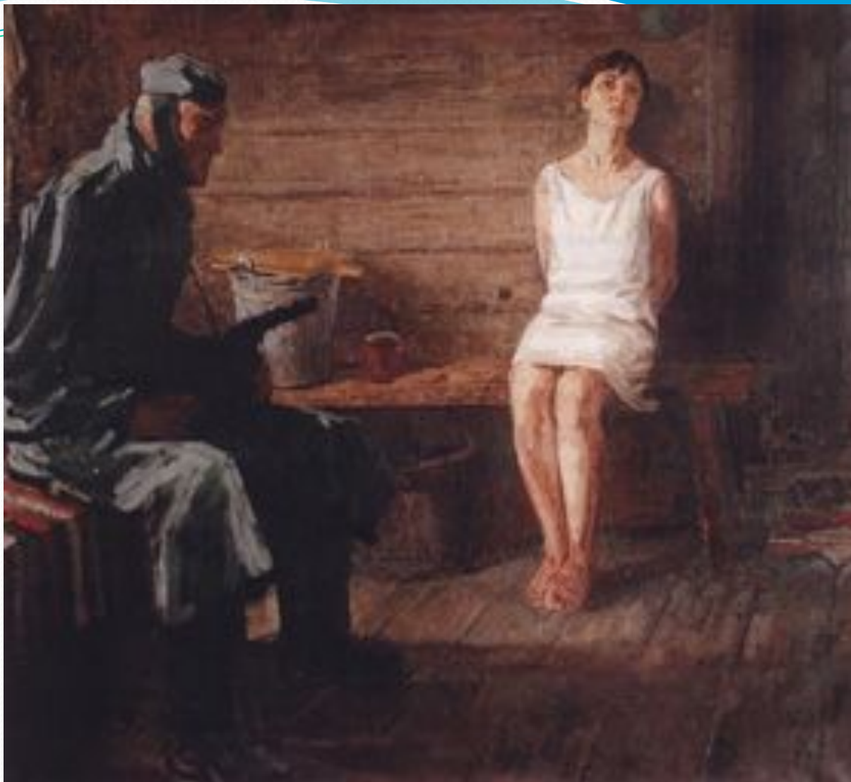
Щукин В.Г. Зоя Космодемьянская - холст, масло