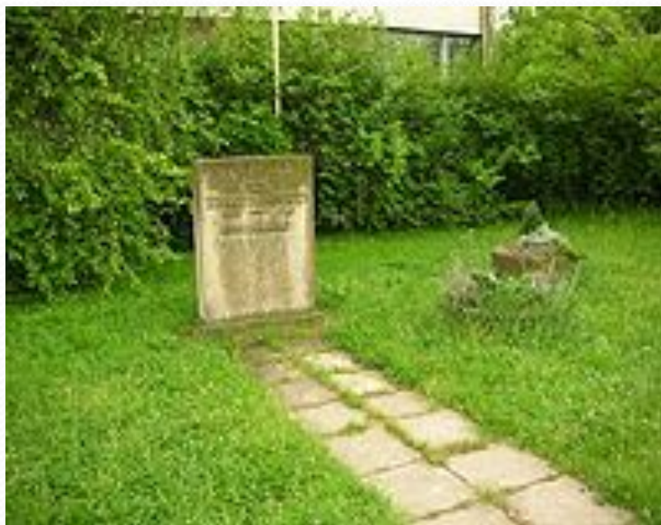
Обелиск в память Зои Космодемьянской перед 46 средней школой в г. Дрезден