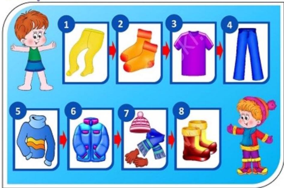
Алгоритм одевания одежды весной и осенью