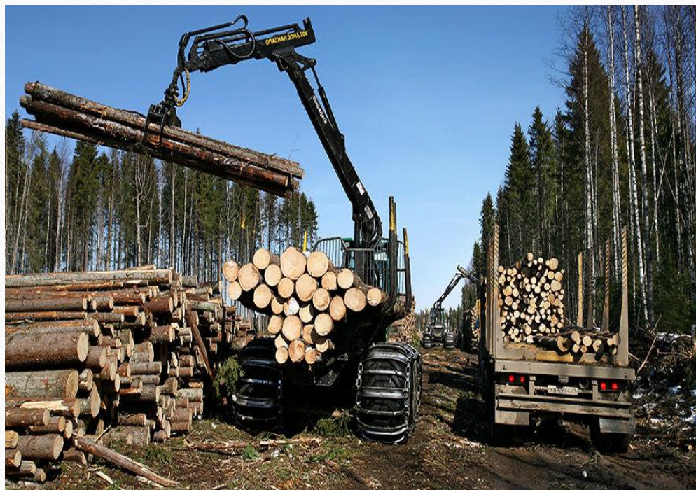
Производственный комплекс в с. Вострово