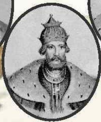
Дмитрий 1250 – 1294 Новгородский, Переяславский, Владимирский князь