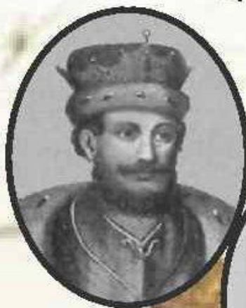
Василий 1245 – 1271 Новгородский князь