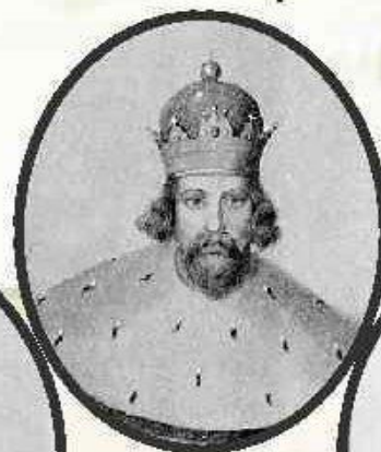
Андрей 1255 – 1304 Костромской, Владимирский, Новгородский, Городецкий князь