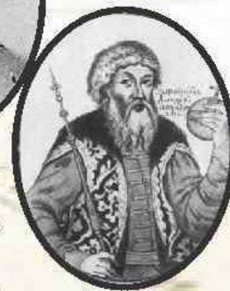
Даниил 1261 – 1303 Московский князь

В 1239 году Александр женился на дочке Брючислава Полоцкого Александре. У них было пятеро детей: сыновья Василий (1245–1271 г., новгородский князь), Дмитрий (1250–1294 г., новгородский, переяславский, владимирский князь), Андрей (1255–1304 г., костромской, владимирский, новгородский, городецкий князь), Даниил (1261–1303 г., московский князь), а также дочь Евдокия.