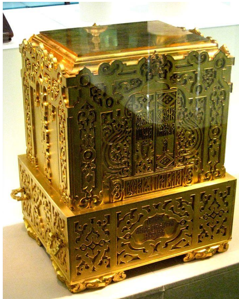
Ларец – ковчег для хранения Русской правды