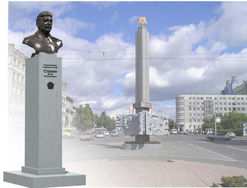
Эскизный проект памятника И.В. Сталину