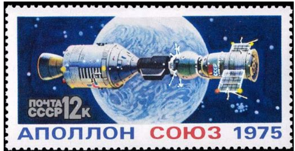
Почтовая марка „Союз-Аполлон“ в СССР

Период "разрядки" ознаменовала новая сдержанная политика Брежнев . Проведены множественные совместные мероприятия США и СССР. Но это не означало конец Холодной войны.