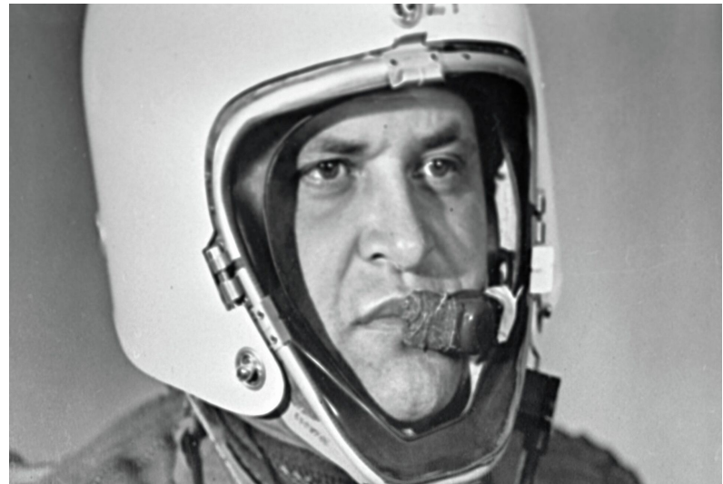
Френсис Пауэрс – лётчик, сбитый над территорией СССР