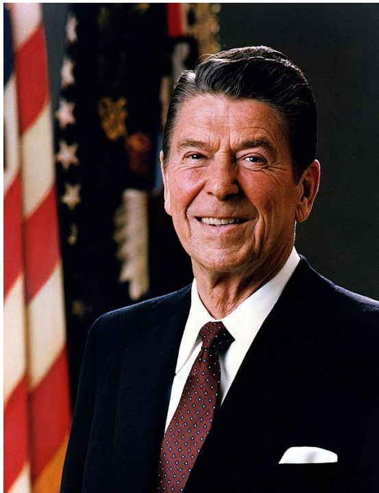
Рональд Рейган – 40-й президент США

Ввод советских войск в Афганистан вновь накалил обстановку. Президент США Рейган назвал СССР "империей зла"