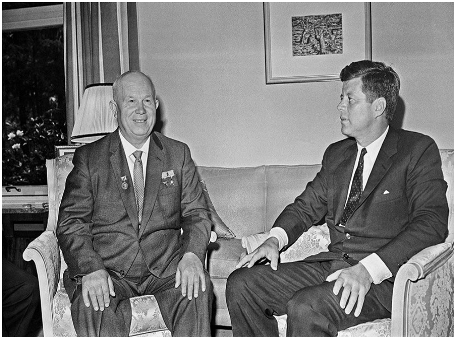
Главы СССР и США во время встречи в Женеве

Однако некоторые проблемы оставались нерешёнными. Обнаружение американского лётчика-разведчика над территорией СССР усугубило ситуацию.