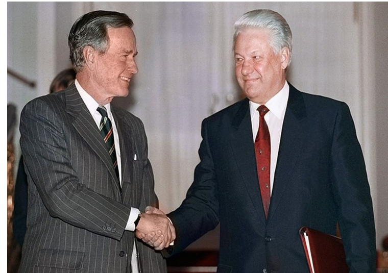
Подписание Кэмп-Дэвидской декларации 1992 г.