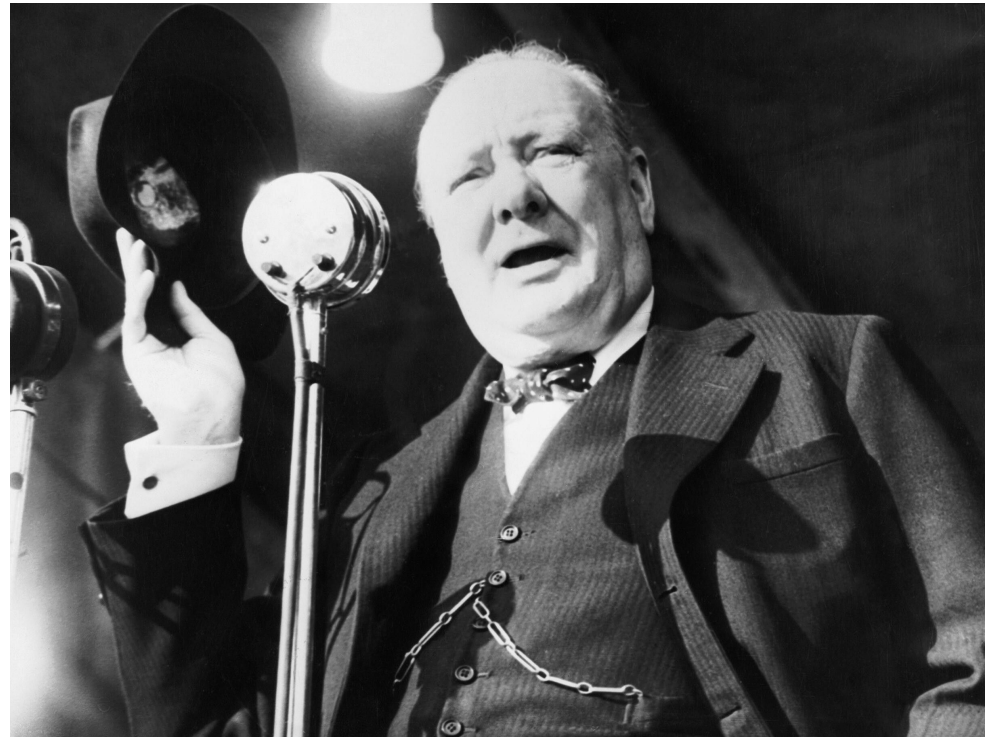
Черчилль произносит свою речь в Фултоне

5 марта 1946 года считается формальным началом Холодной войны.