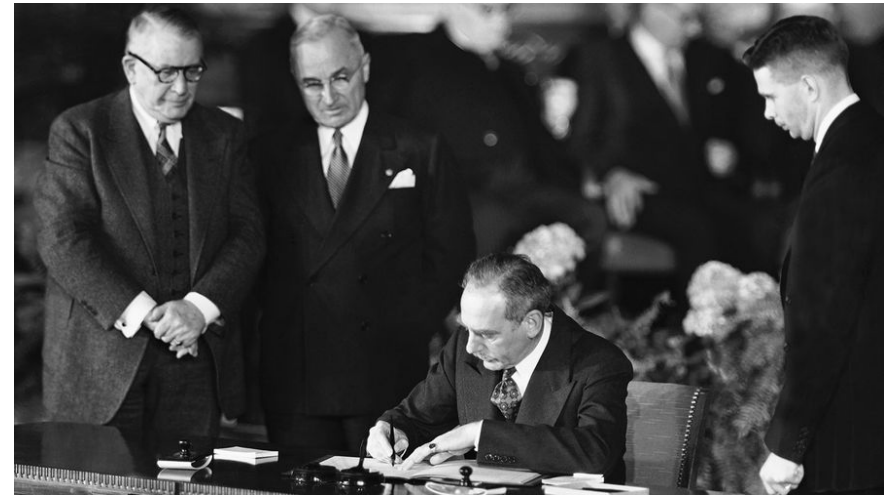
Подписание договора о создании НАТО, 1949 г.

США стремились оказать давление на СССР с помощью доктрины Трумэна, резолюции Вандерберга, создания НАТО.