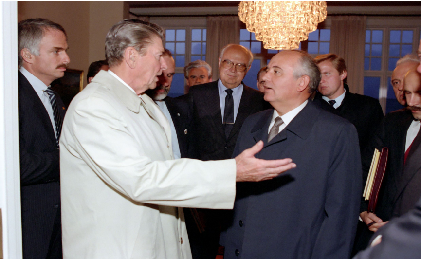
Саммит в Рейкьявике 1986 года

Пришедший к власти Горбачёв взял курс на улучшение отношений с США. СССР была готова пойти на серьёзные уступки. Вследствие "Перестройки" и общего кризиса социалистических стран Холодная война была окончена.