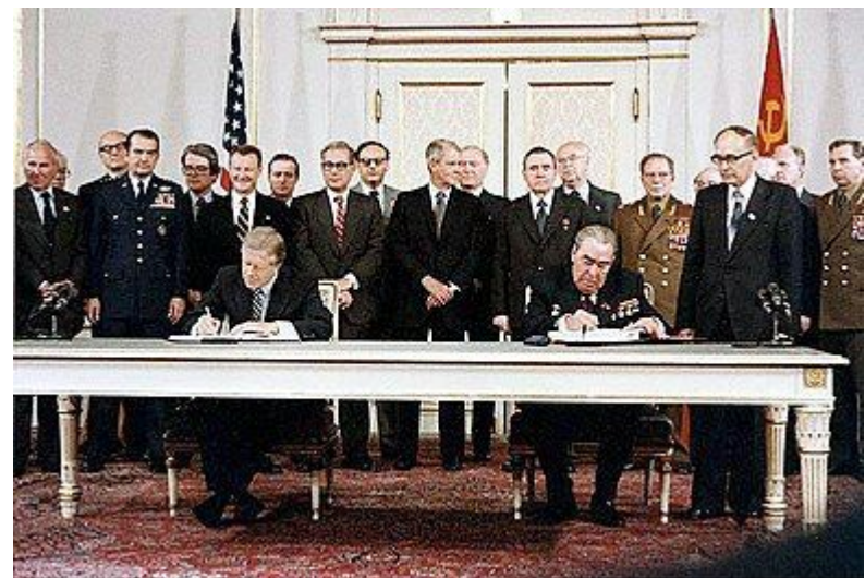
Подписание договора ОСВ