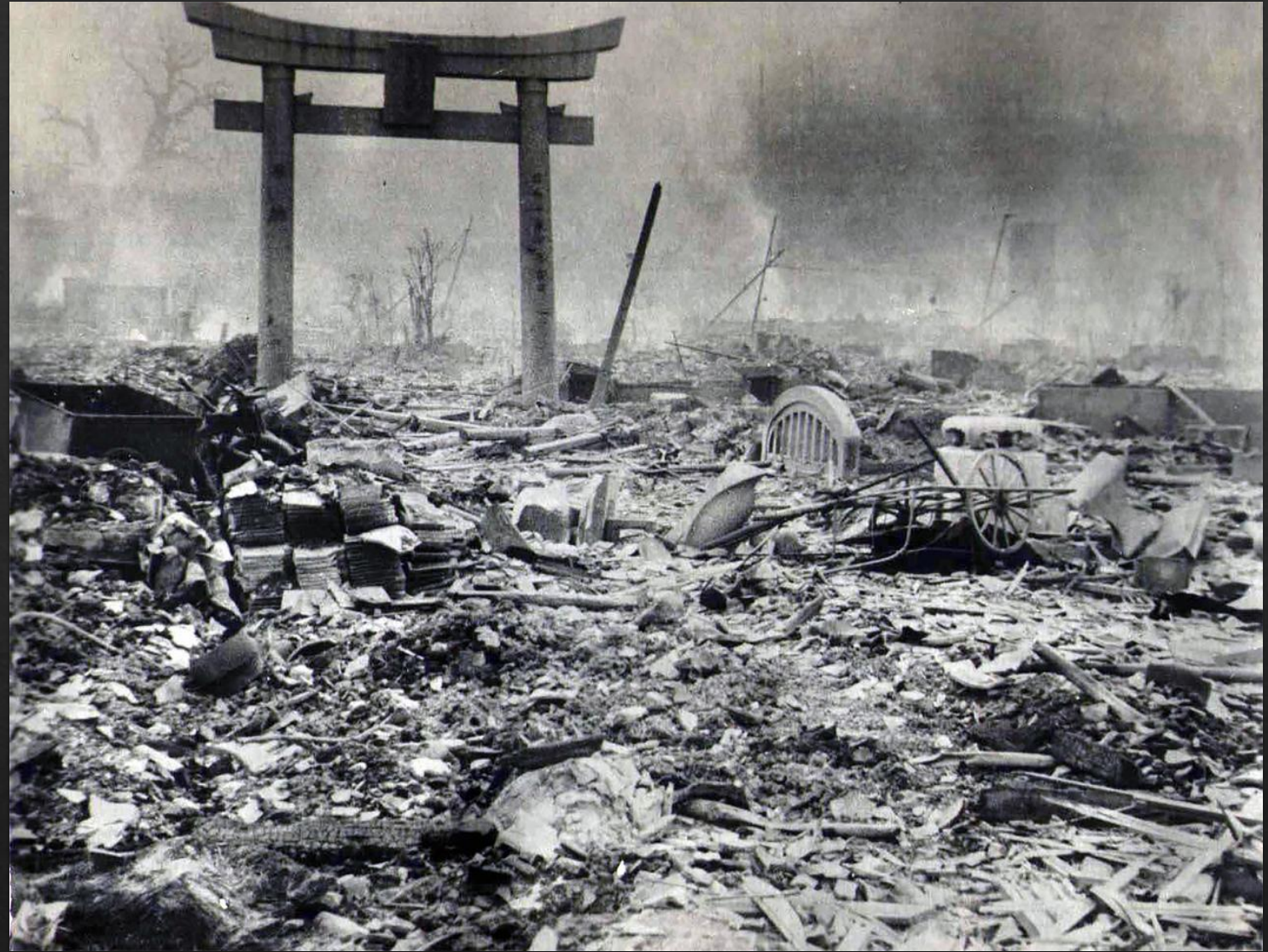
Руины Хиросимы после ядерного удара