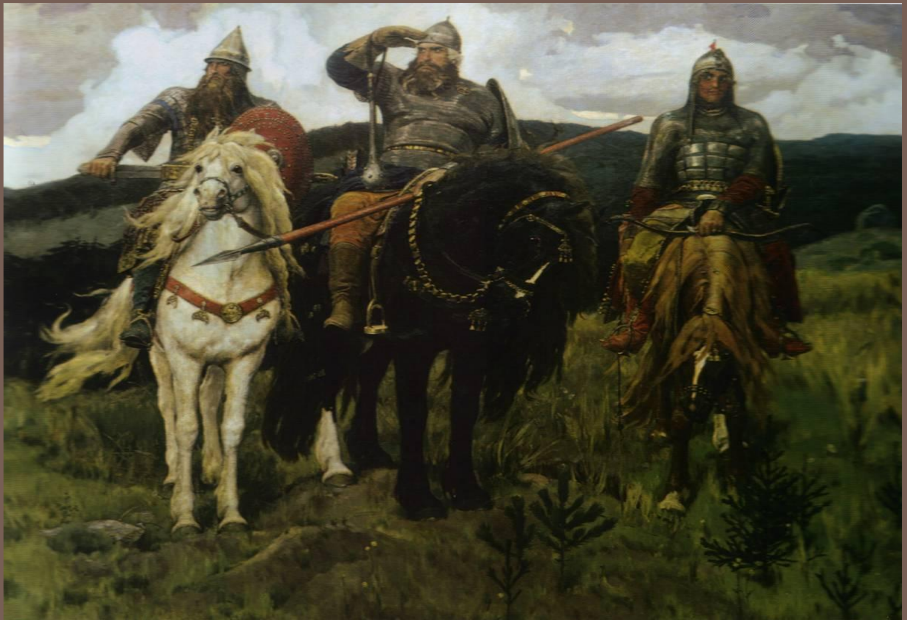
Картина «Богатыри» – любимое детище Виктора Михайловича Васнецова.