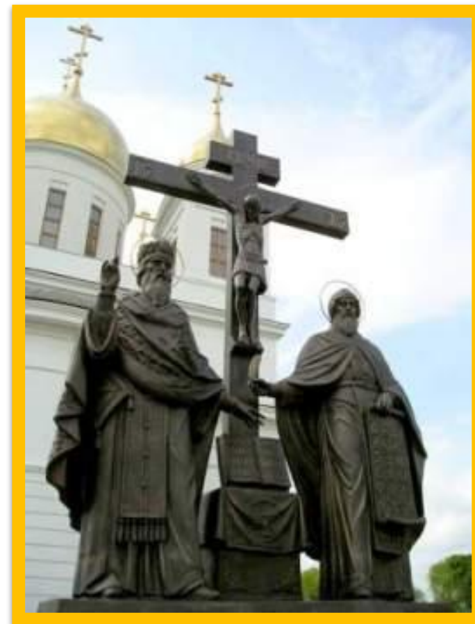
Памятники Кириллу и Мефодию