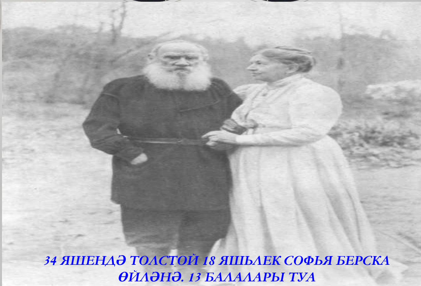
34 ЯШЕНДЭ ТОЛСТОЙ 18 ЯШЬЛЕК СОФЬЯ БЕРСКА ӨЙЛЭНЭ. 13 БАЛАЛАРЫ ТУА