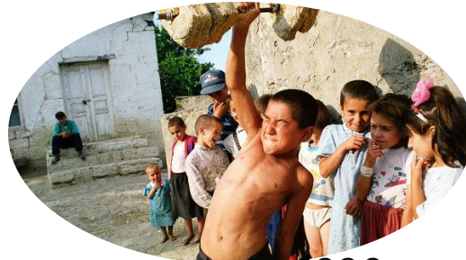
Джалганские дети 1996 год