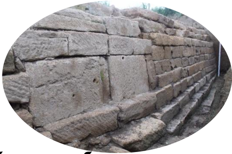
Рубасская оборонительная стена

Бывшее горско-еврейское село. В начале XX века было заселено переселенцами из Полтавской губернии.