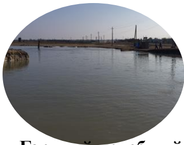
Горячий целебный источник