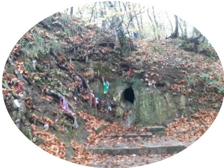
Святой источник (пир)