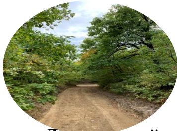
тропинка Джалганский лес

В селе Джалган проживают азербайджанцы, которые говорят на на северокурдском и азербайджанском языках. Также в с. Джалган находится одна из самых старых мечетей Дербентского района