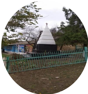
Памятник войнам ВОВ