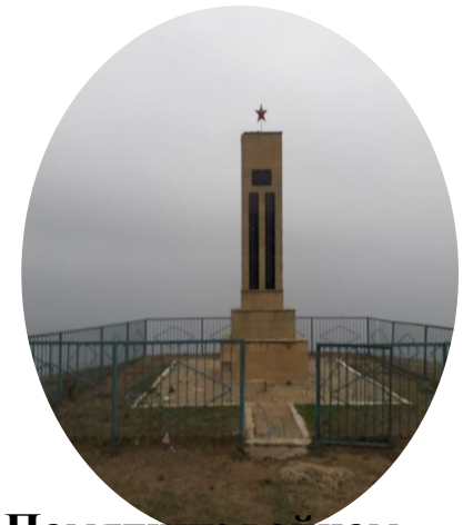
Памятник войнам ВОВ

Джалган — загадочное село с интересной историей. У села есть свои секреты, которые на протяжении многих веков передавались от отцов к детям и внукам. Примечательно, что на самой вершине Джалгана стоит памятник героям Великой Отечественной войны. Родник в священной роще селения Джалган живет бессмертной жизнью. Сюда по традиции приходят кормящие матери, у которых пропало молоко. Священную воду пьют и те, кто страдает бесплодием. По преданию могила Святого Георгия Победоносца находится в с. Верхний Джалган.