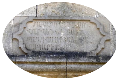
Молитва на стенах храма