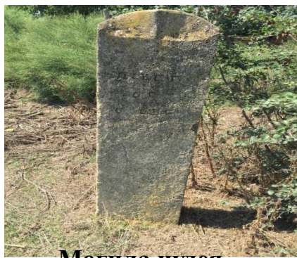
Могила иудея жителя с. Аглоби

С течением времени в с. Аглоби стали селиться также и азербайджанцы. К 50-м годам XX века евреи почти полностью покинули село. После того, как село Аглоби покинули горские евреи, в 1953 году туда переселили жителей села Цилинг Курахского района.