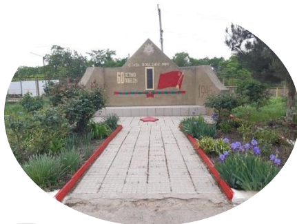
Памятник войнам ВОВ

В 1869 году из 74 дворов аула 68 были горско-еврейскими. В 1897 году горские евреи составляли 94% населения аула. В настоящее время в Нюгди проживает лишь несколько горско-еврейских семей. Большинство иудейской общины села в 1990-х годах эмигрировало в Израиль.