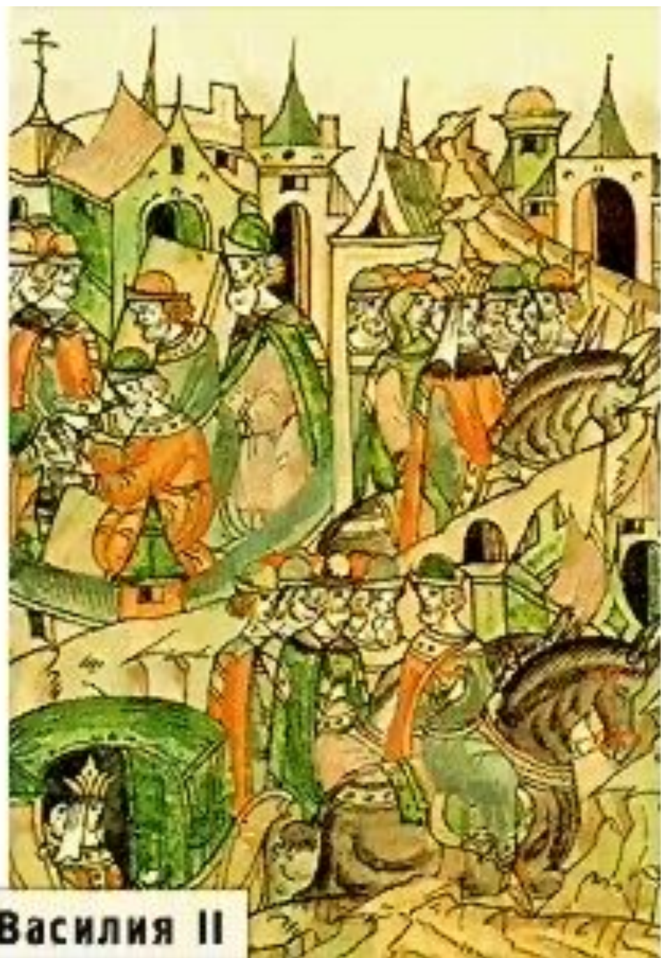
Ослепление Василия II