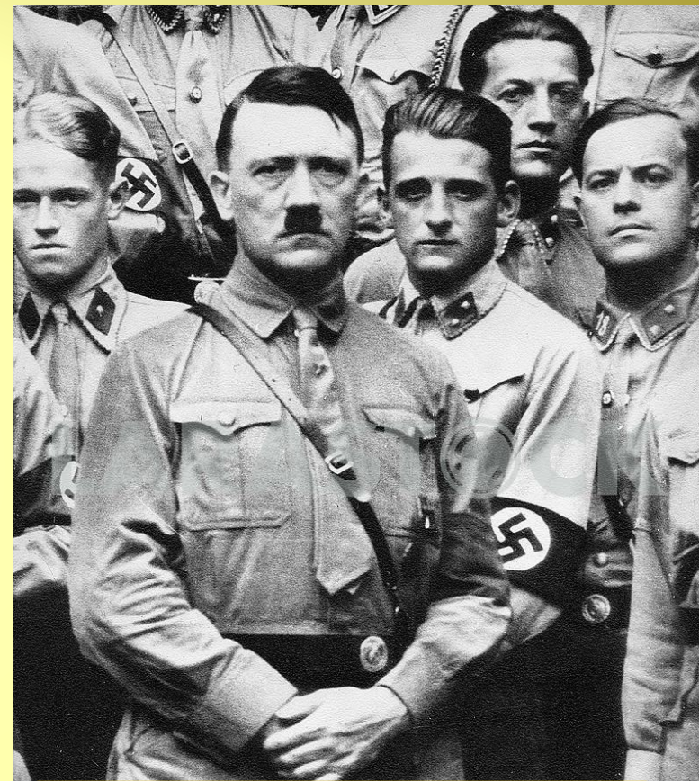
Адольф Гитлер (1934- 1945 гг.) – политический деятель, фюрер (вождь), НСДАП, диктатор нацистской Германии