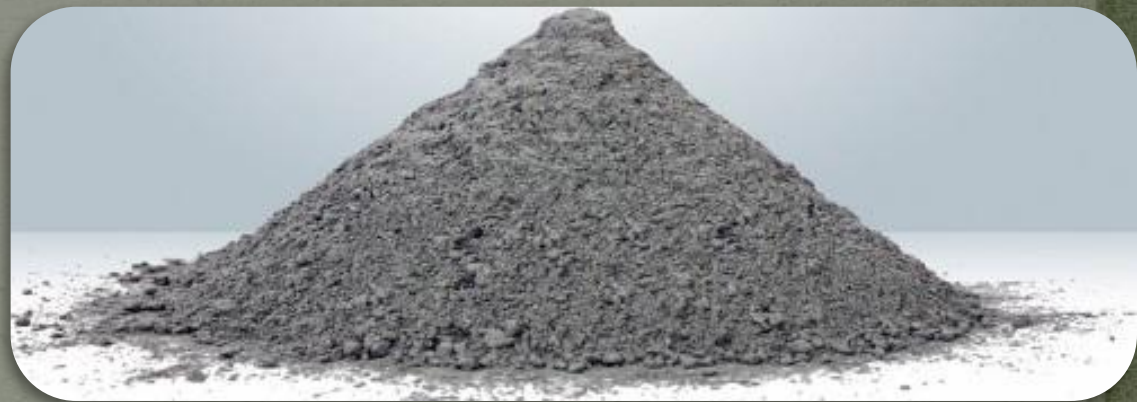
Глинозёмистый цемент -