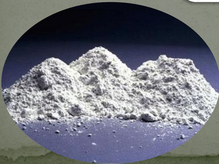
- Молотый гипсовый камень