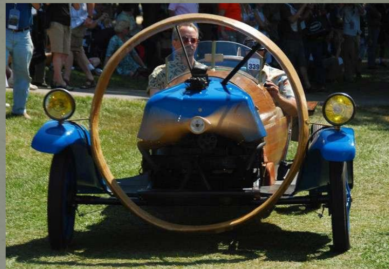
Копия французского спортивного аэромобиля Heligon