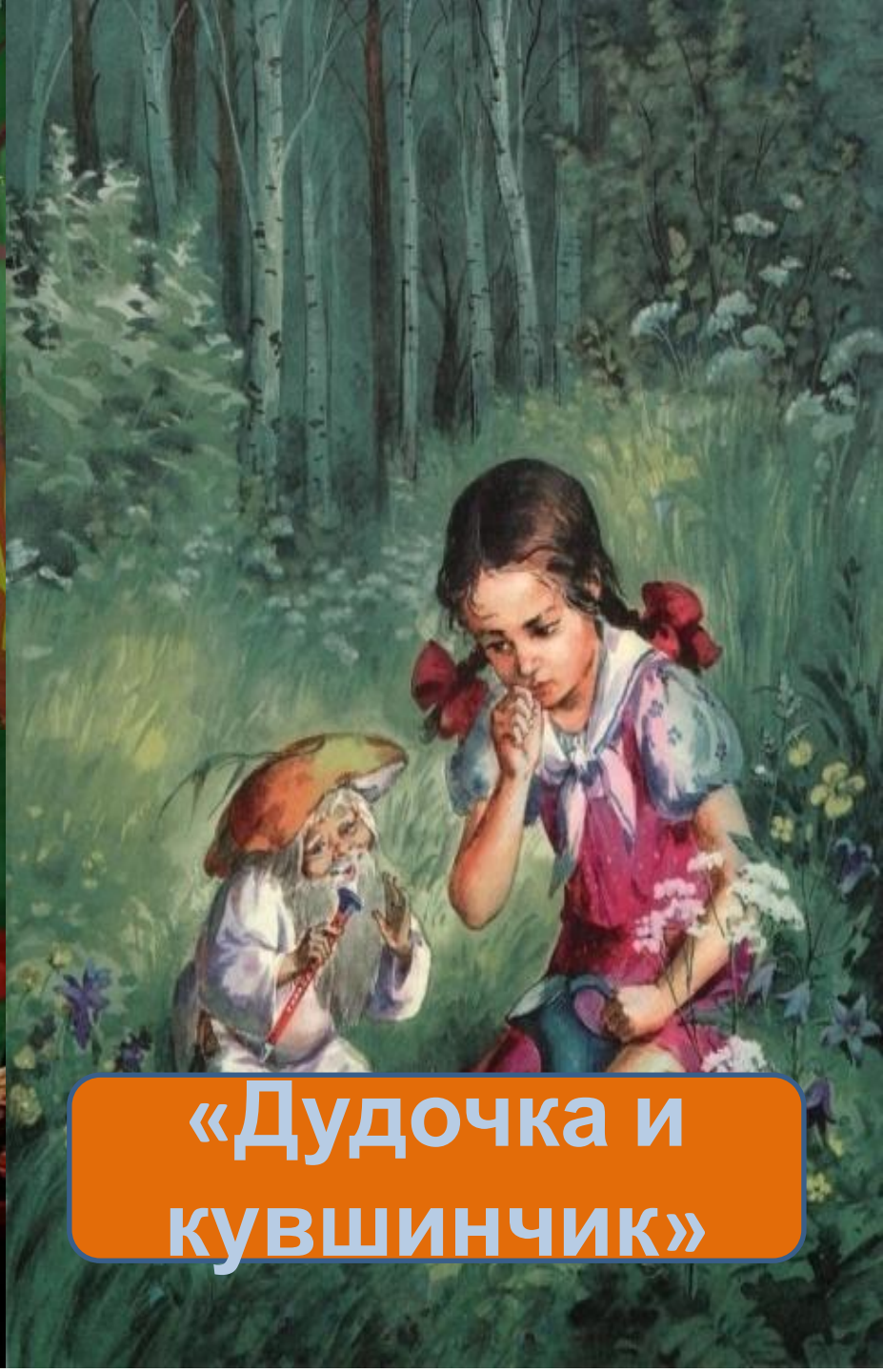
«Дудочка и кувшинчик»