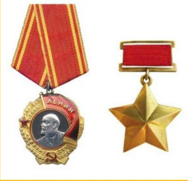
Орден Ленина и Звезда Героя Советского Союза.