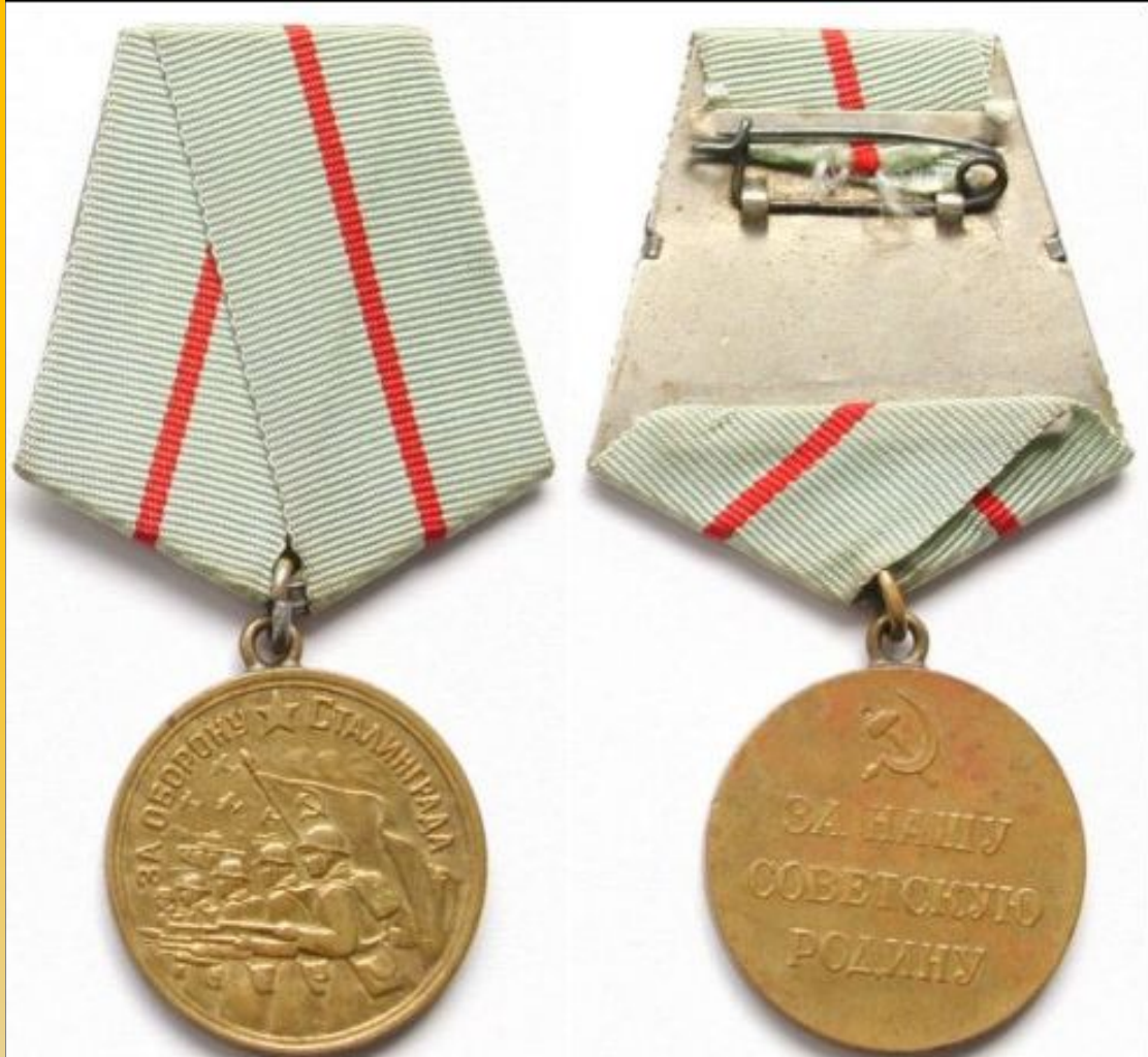
Медаль «За оборону Сталинграда»