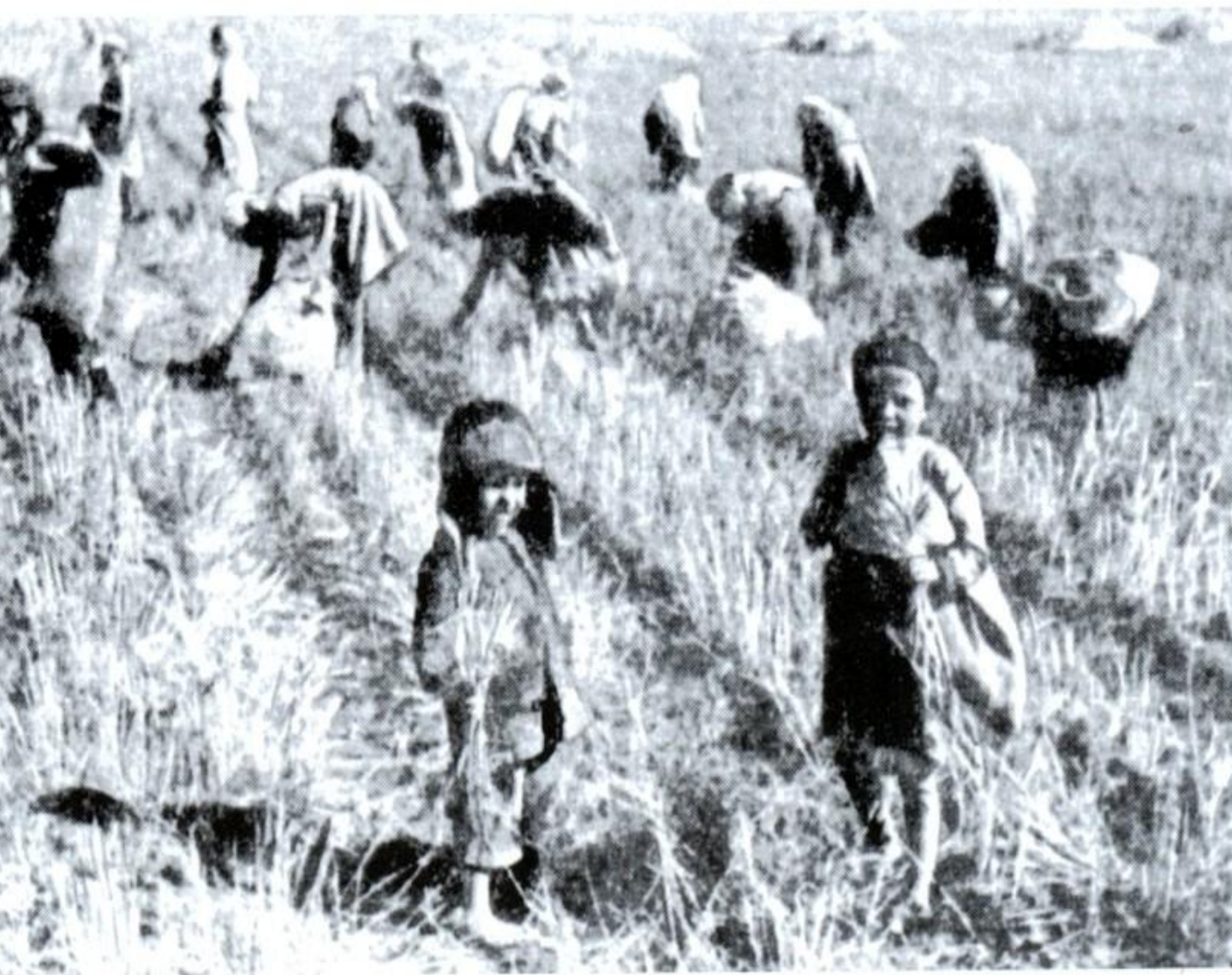
Дети собирают колоски. 1943г.