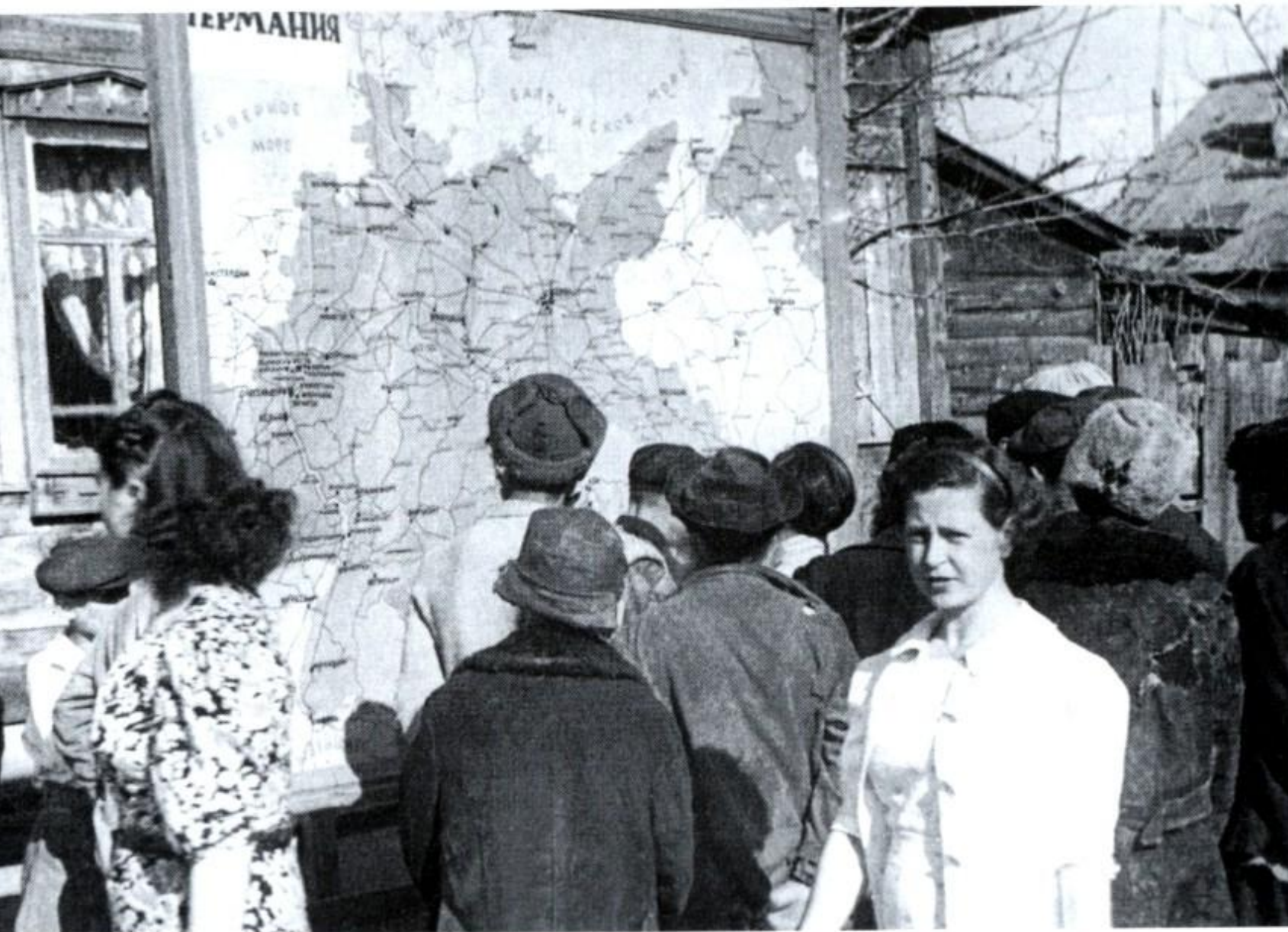
У карты Германии.