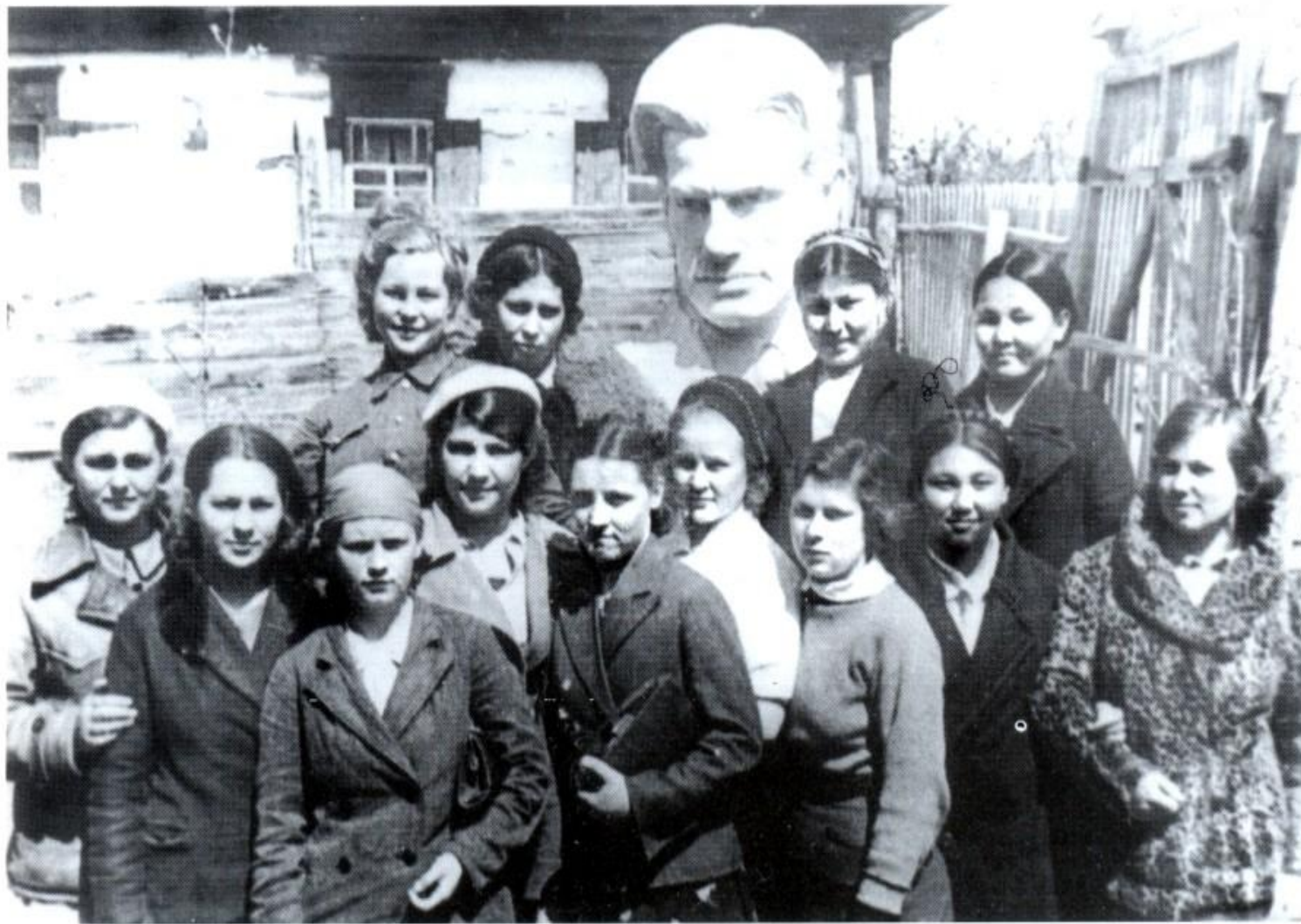
Павлодарки-добровольцы перед уходом на фронт. Май 1942г.