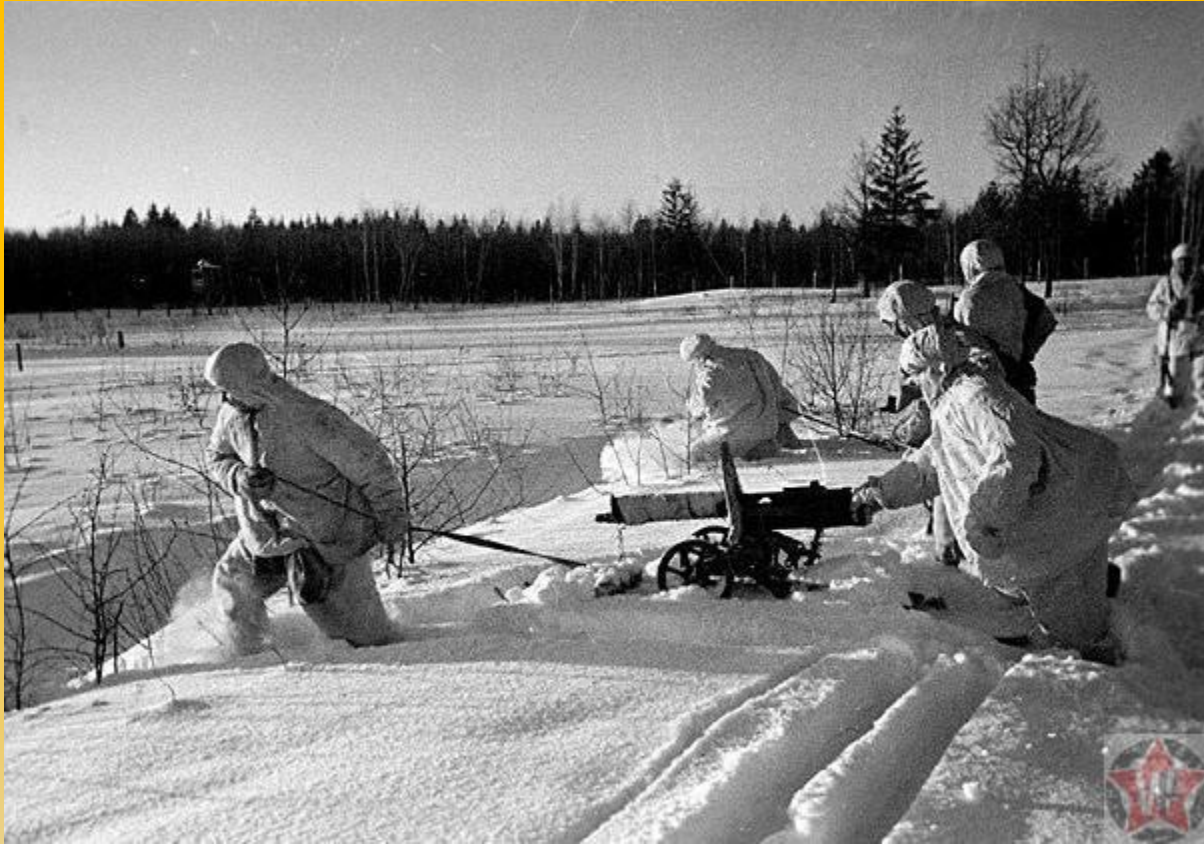
Контрнаступление: бойцы пулеметного подразделения передвигаются к переднему краю