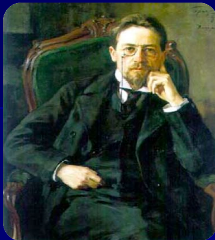
А.П.Чехов - Н.А.Хлопову

Знаки препинания, служащие нотами при чтении, расставлены у вас, как пуговицы на мундире гоголевского городничего.