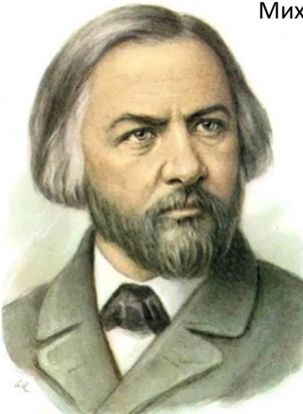
Михаил Иванович Глинка