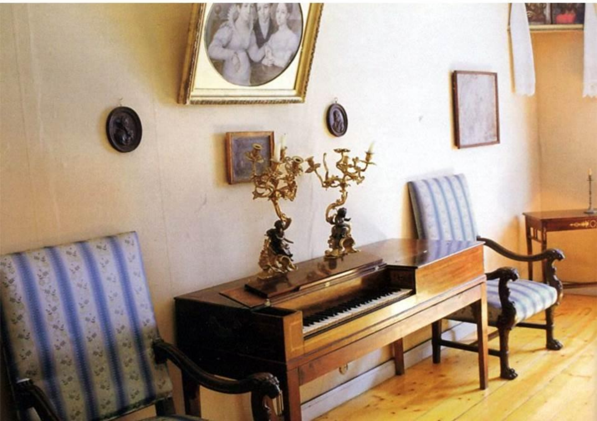
Музей-усадьба М.И. Глинки. Кабинет отца композитора.