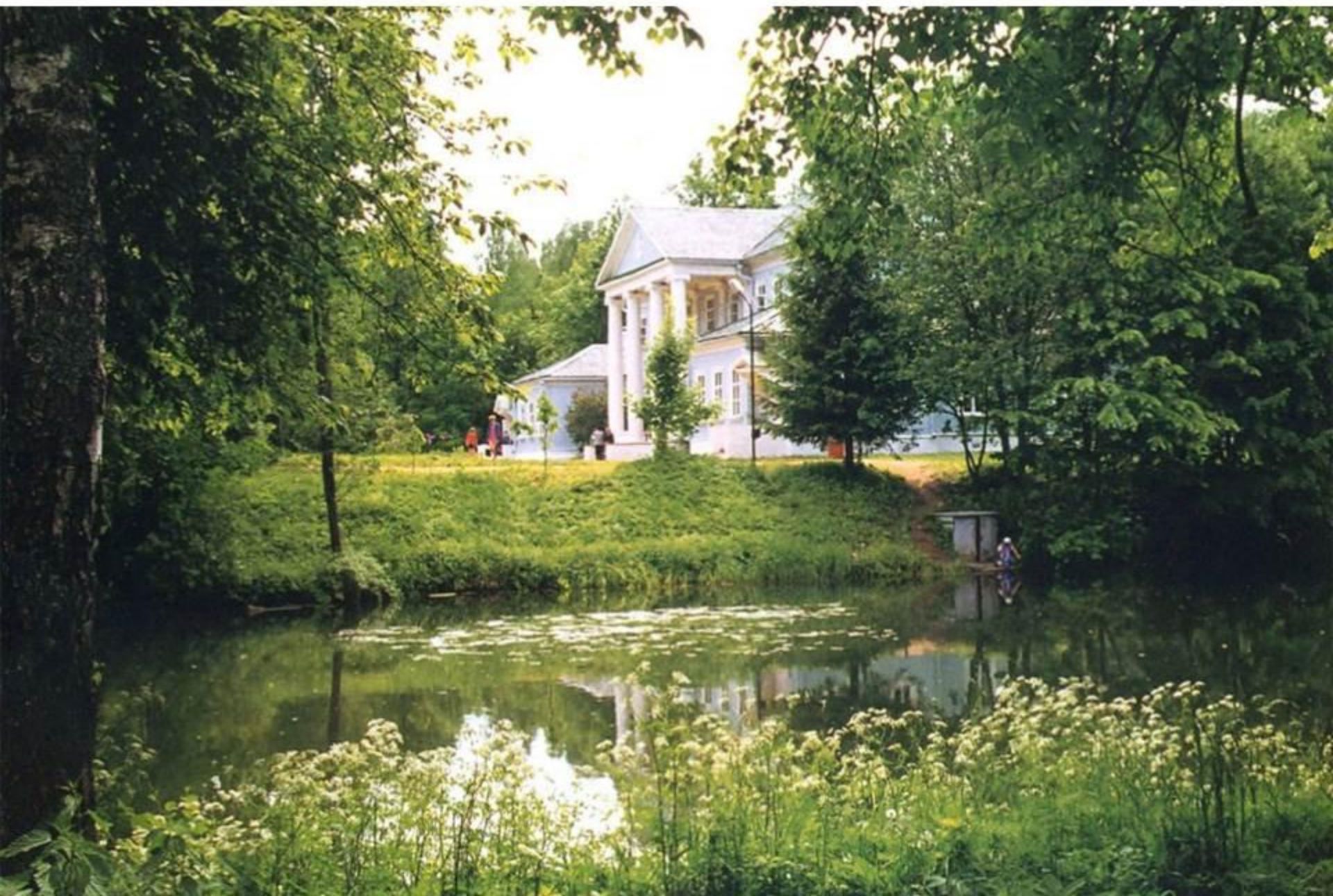
Музей-усадьба М.И. Глинки в селе Новоспасское. Главный дом.