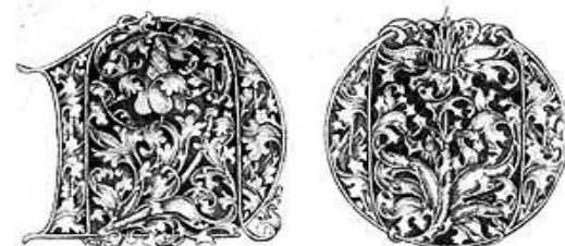
Израиль ван Мекенем. Лист из серии «Большой прописной алфавит»