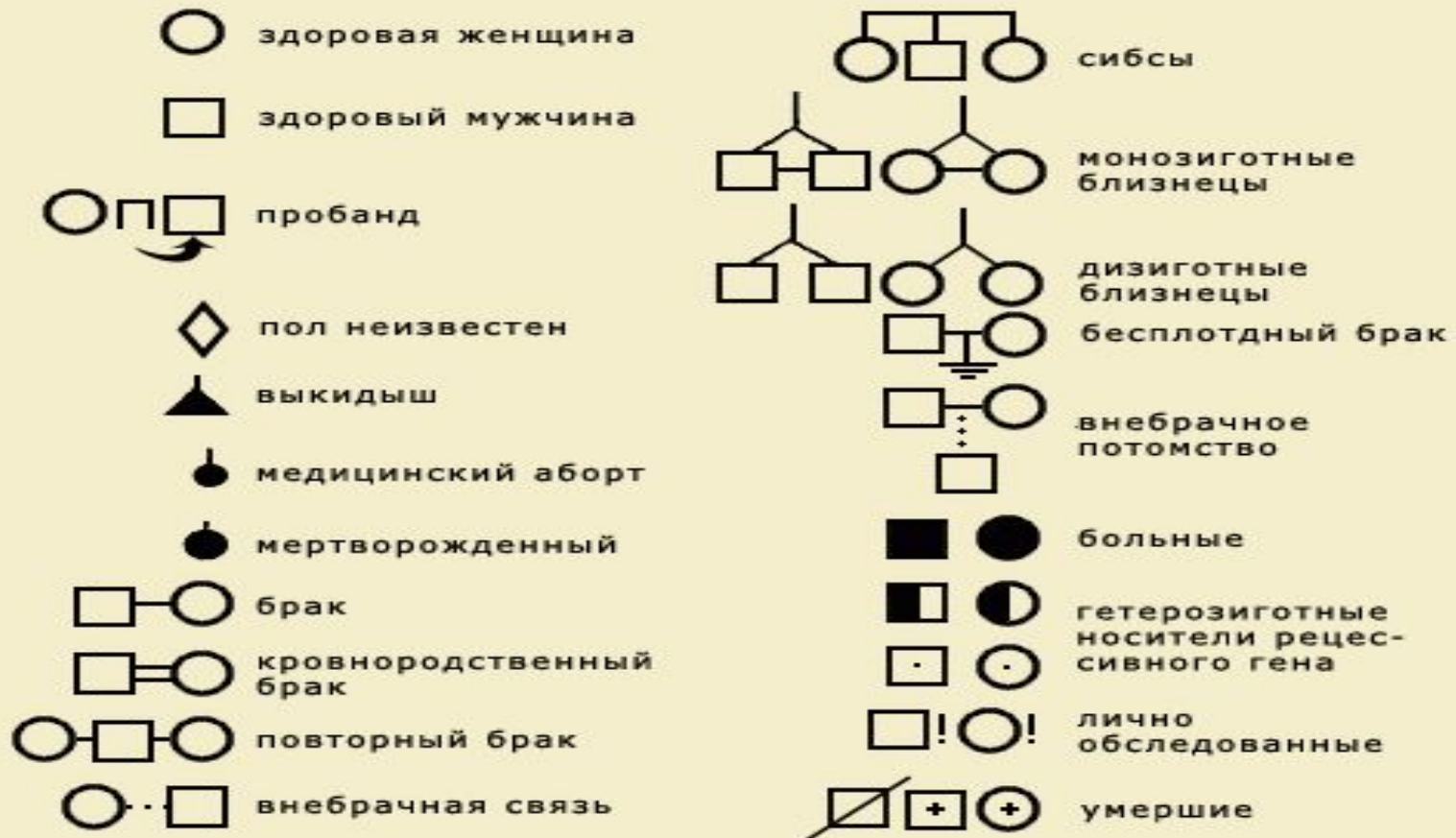
Рис. 7.6 Символы, используемые при составлении родословных