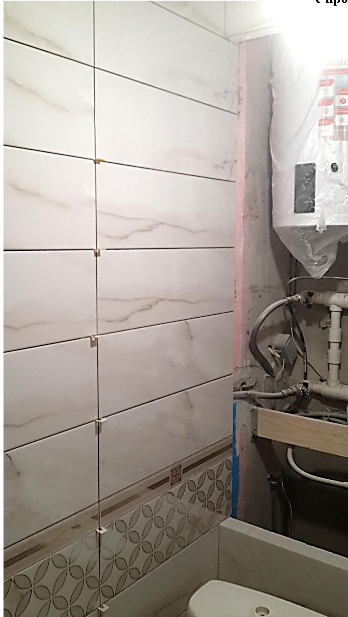
Фото санузла с проемом под рольставни