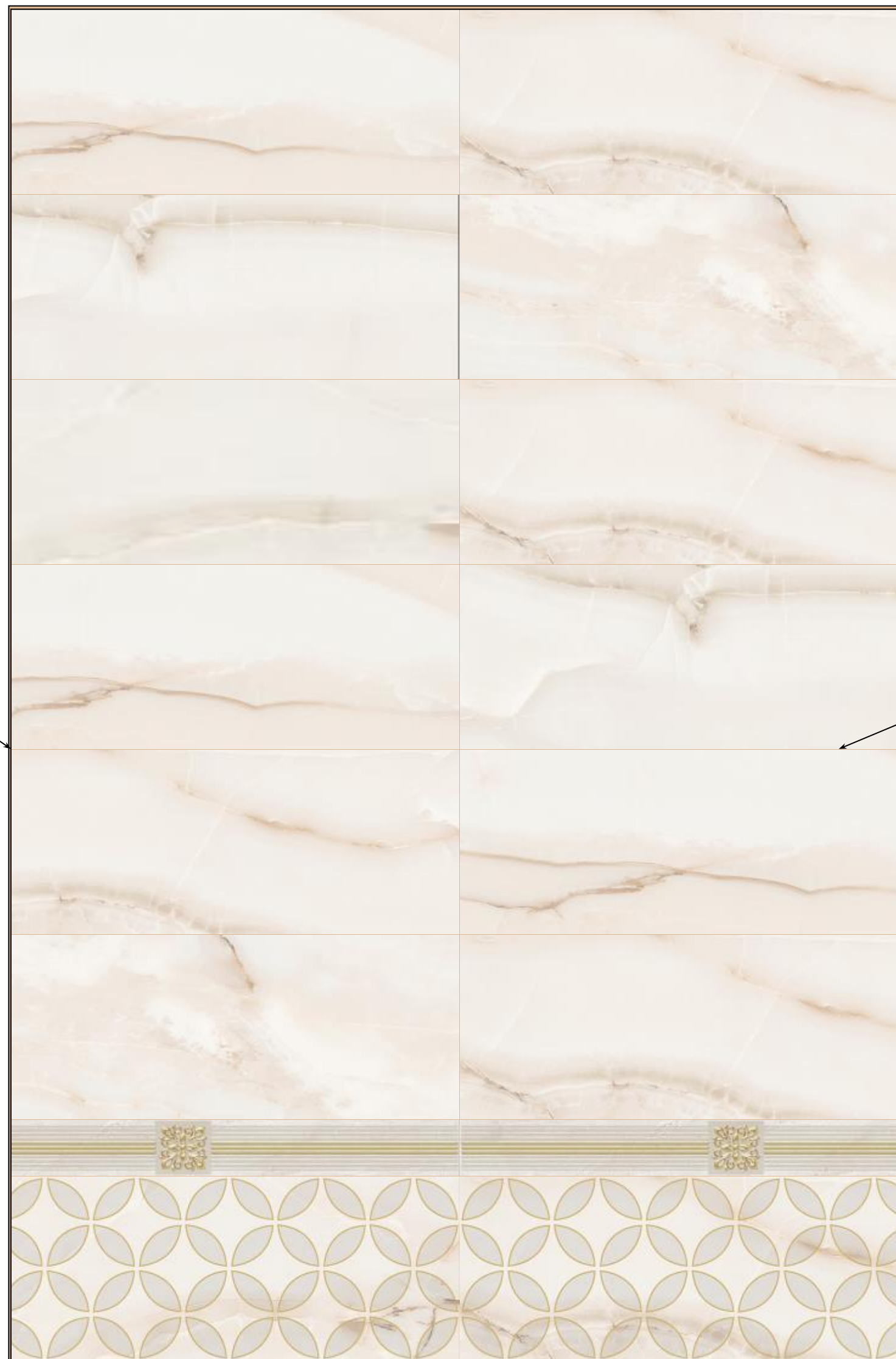
Рисунок после сжатия

2. Плитка обрезана по краям под проем для рольставней