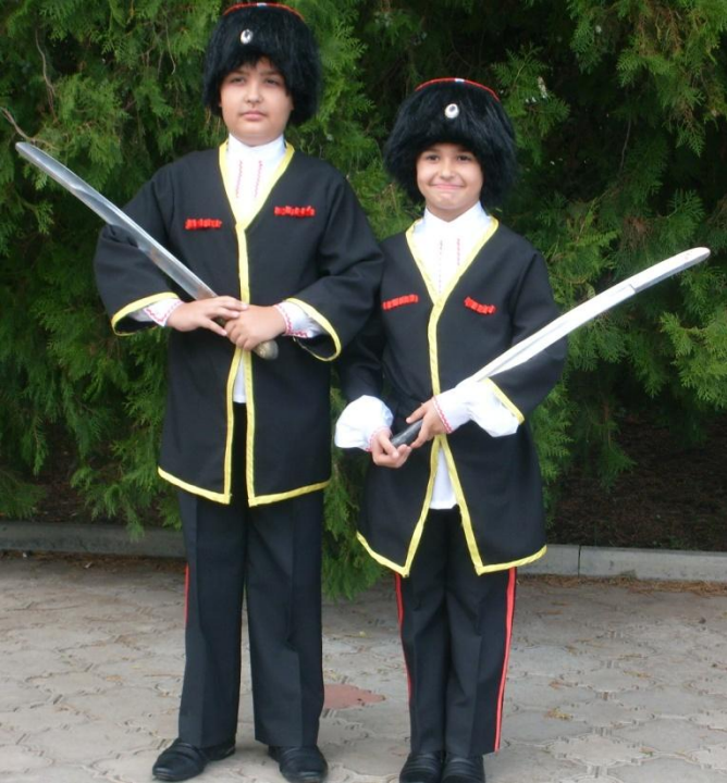
Костюм кубанских казаков