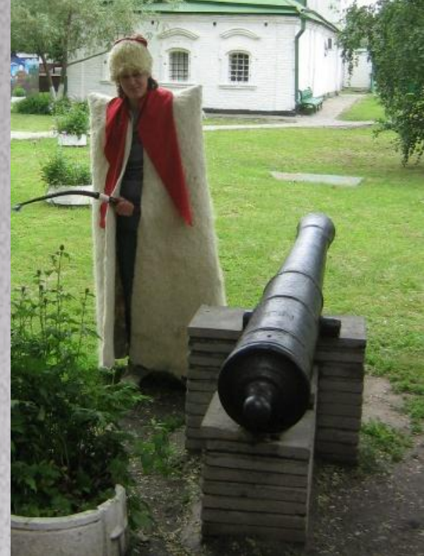
Костюм донских казаков