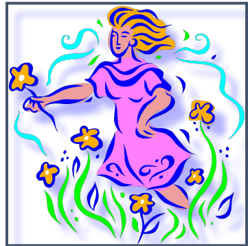
прогулки на свежем воздухе