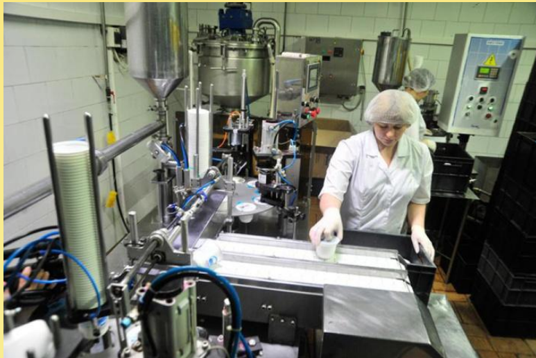
Фото автора работы