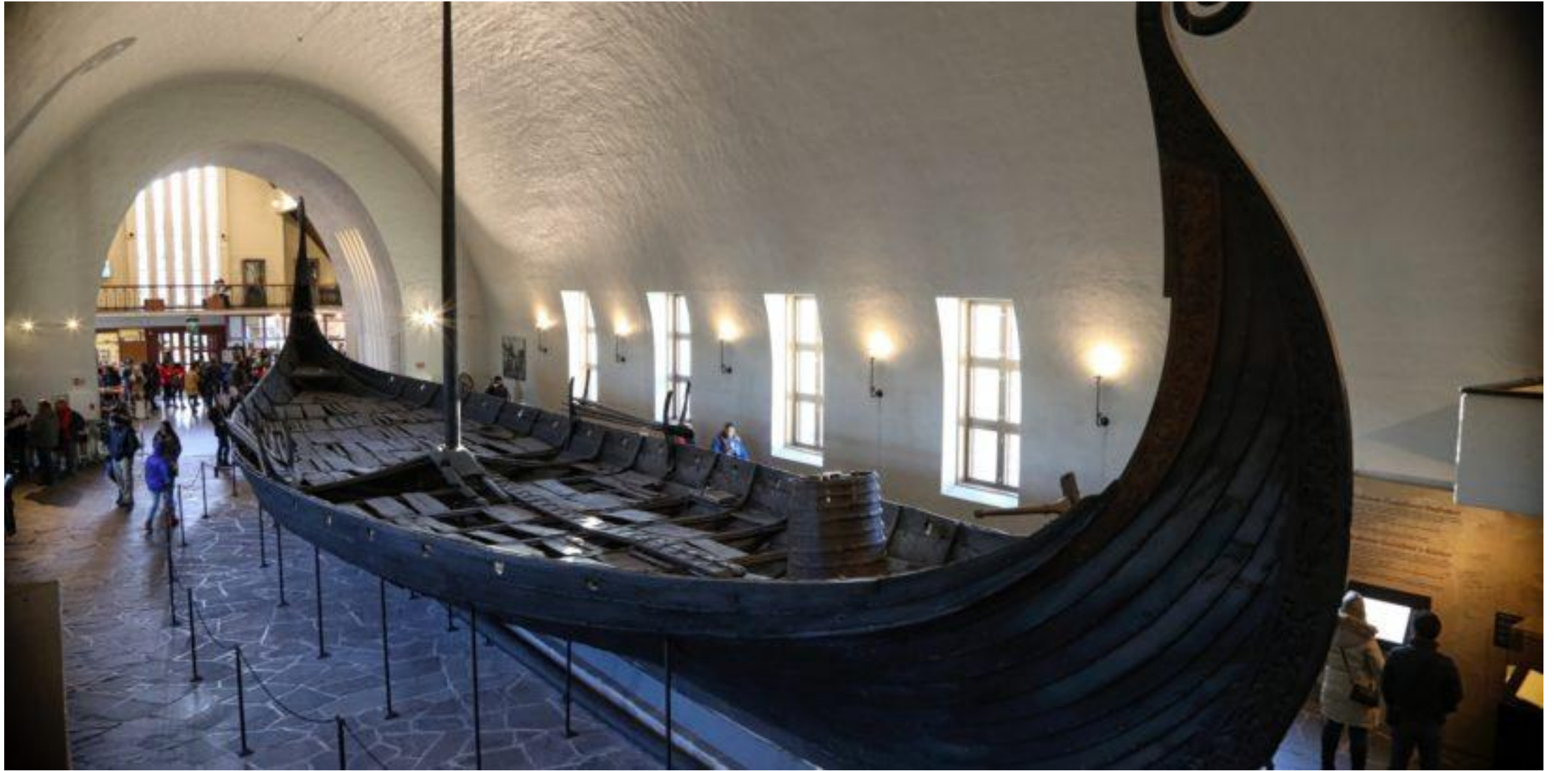
The Viking Ship Museum, EASTERN NORWAY / OSLOFJORD / OSLO