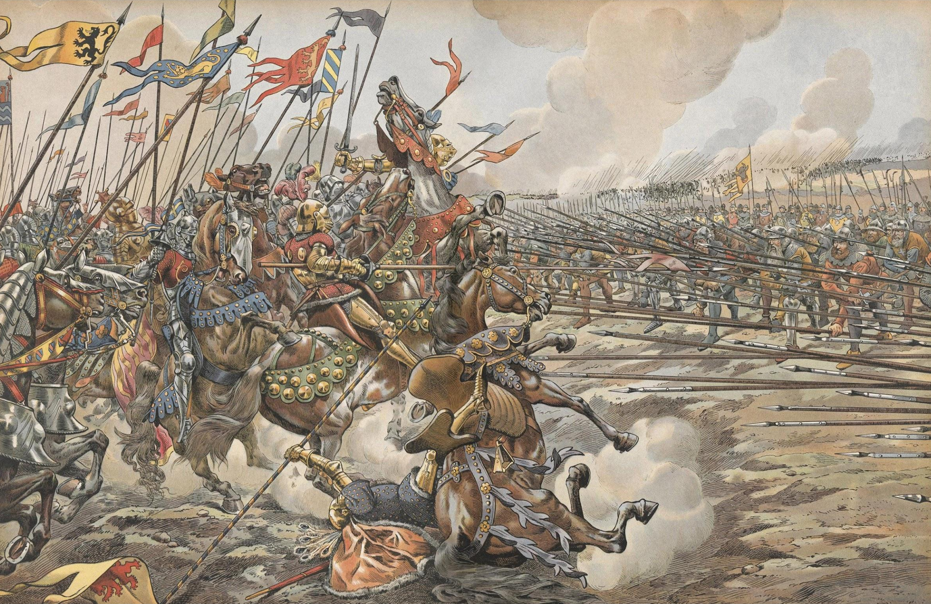
Битва при Нанси. Рисунок