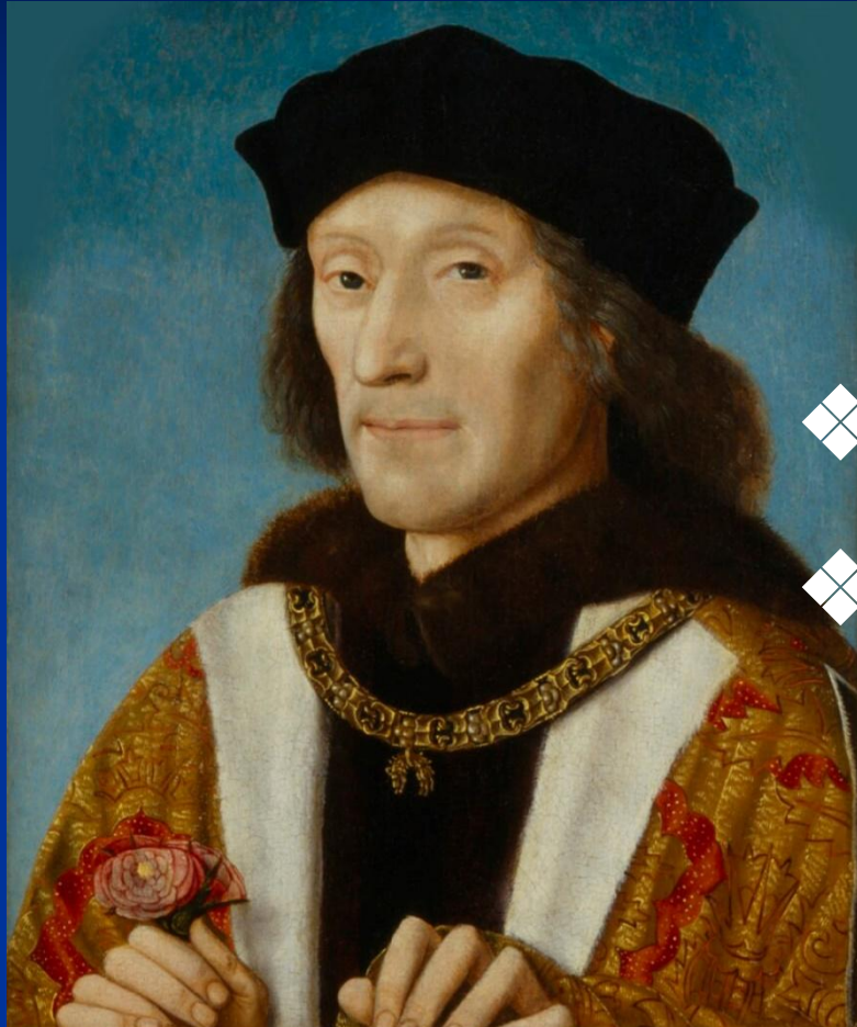
Генрих VII. Портрет XVI в.

1485 – 1509 – правление Генриха VII Тюдора