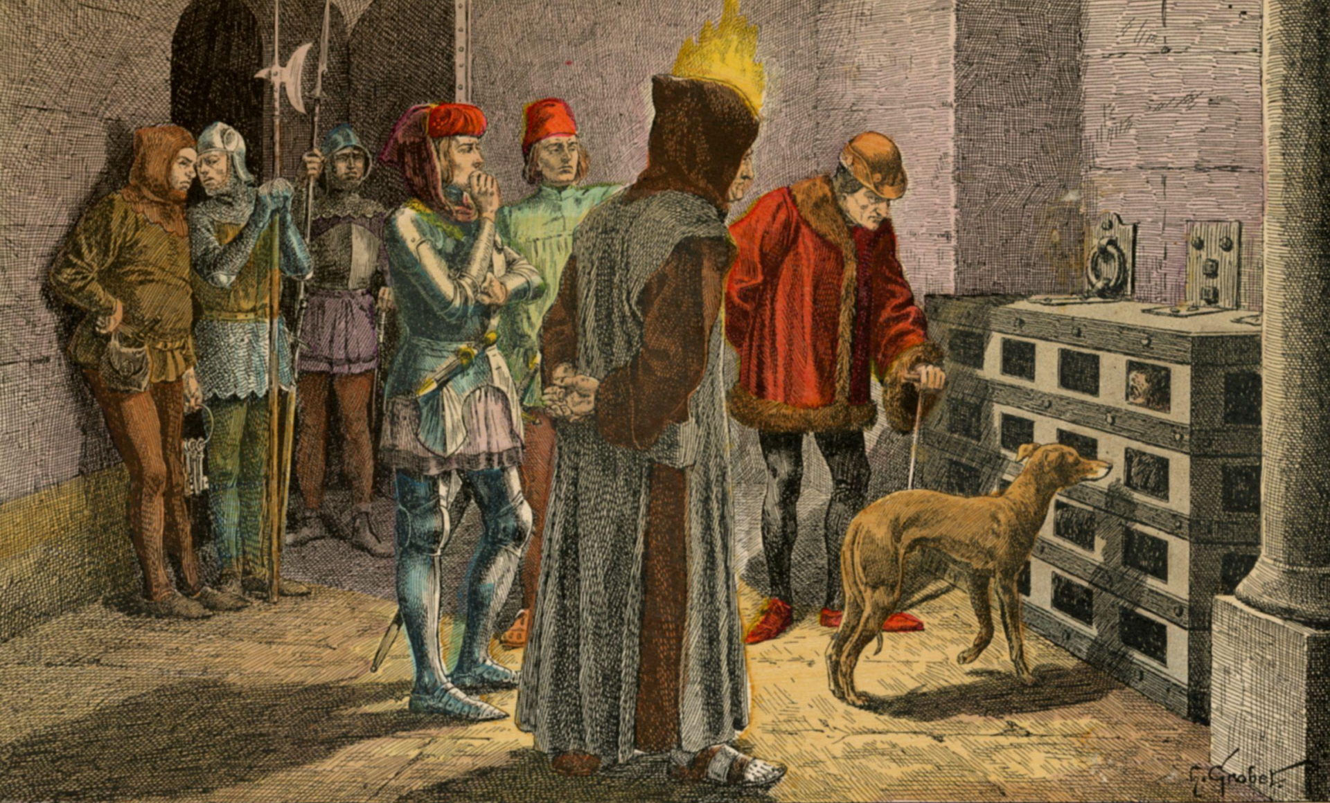
Людовик XI и его пленник. Рисунок