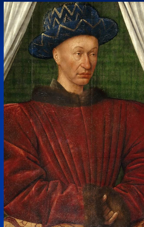
Карл VII. Портрет XV в.