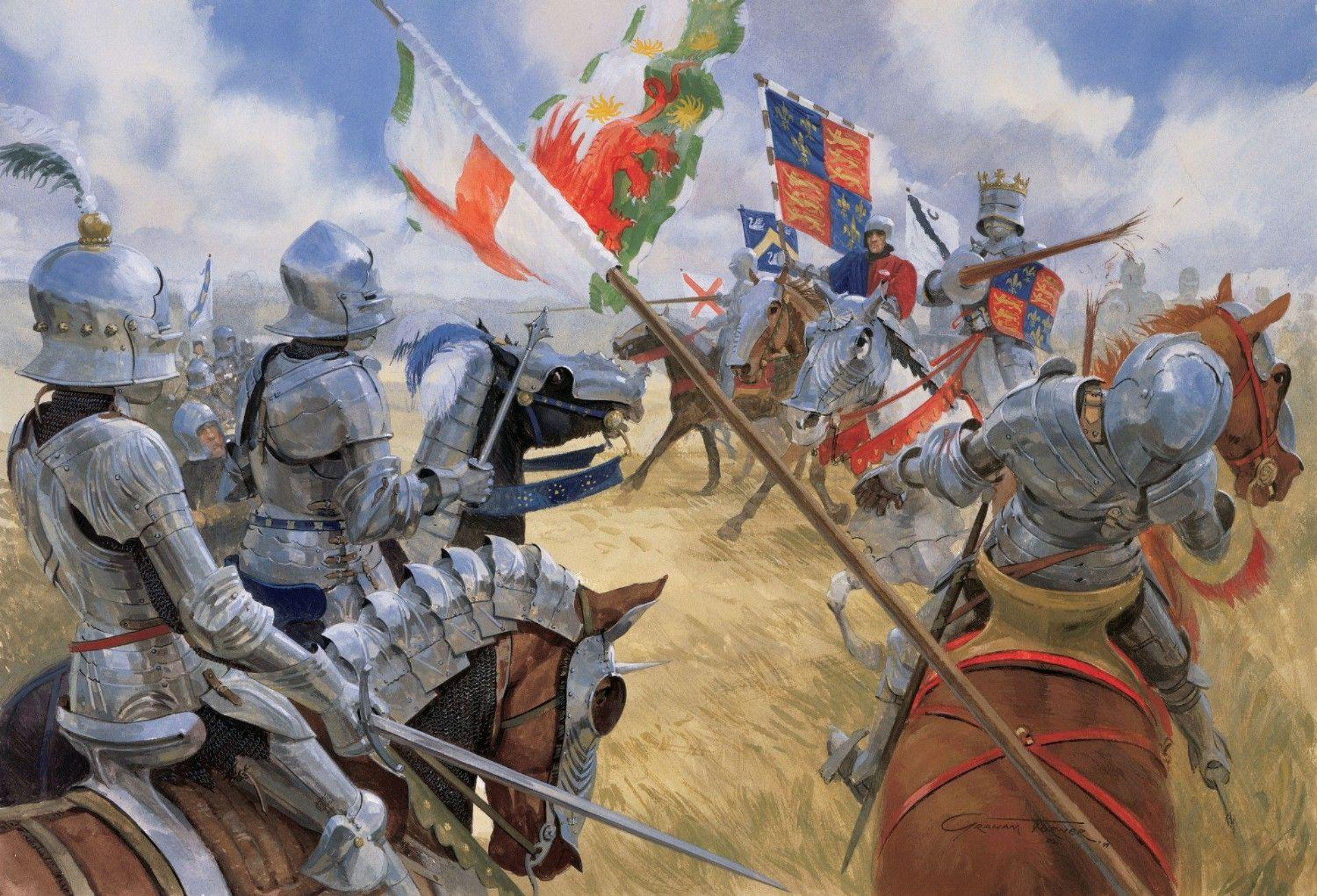
Битва при Босворте. Рисунок