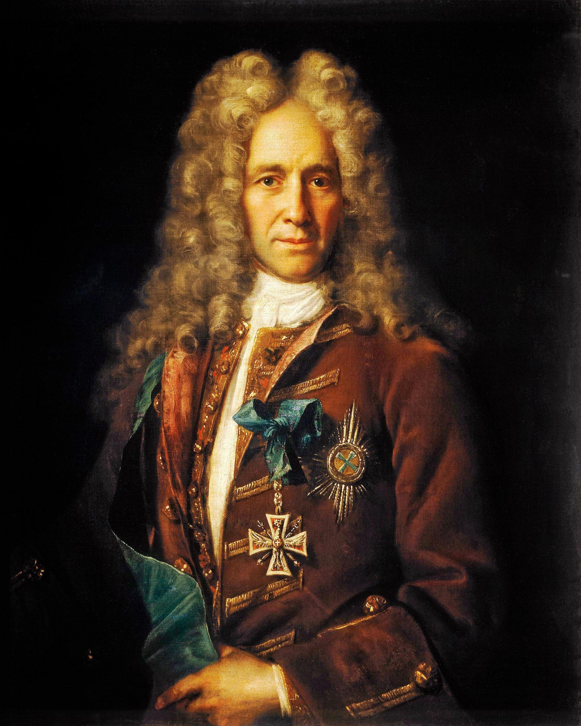
И.Н. Никитин Портрет канцлера Г. И. Головкина