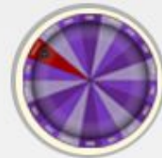
Spin to Win