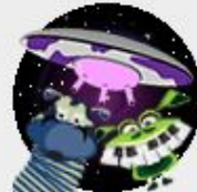
Have U Herd