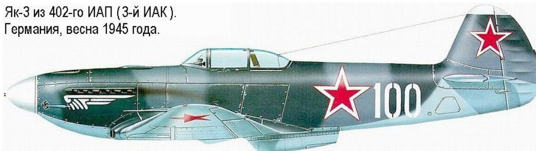
Як-3 из 402-го ИАП (3-й ИАК). Германия, весна 1945 года.