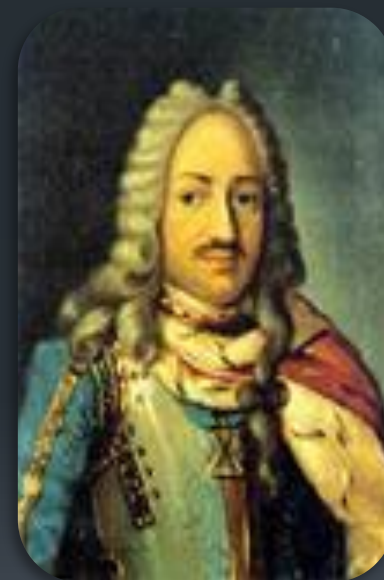
Лефорт Франц Яковлевич

Во время правления Петра I была организована дипломатическая миссия России в Западную Европу в 1697—1698 годах, которую возглавлял Лефорт и которая называлась «Великое посольство».