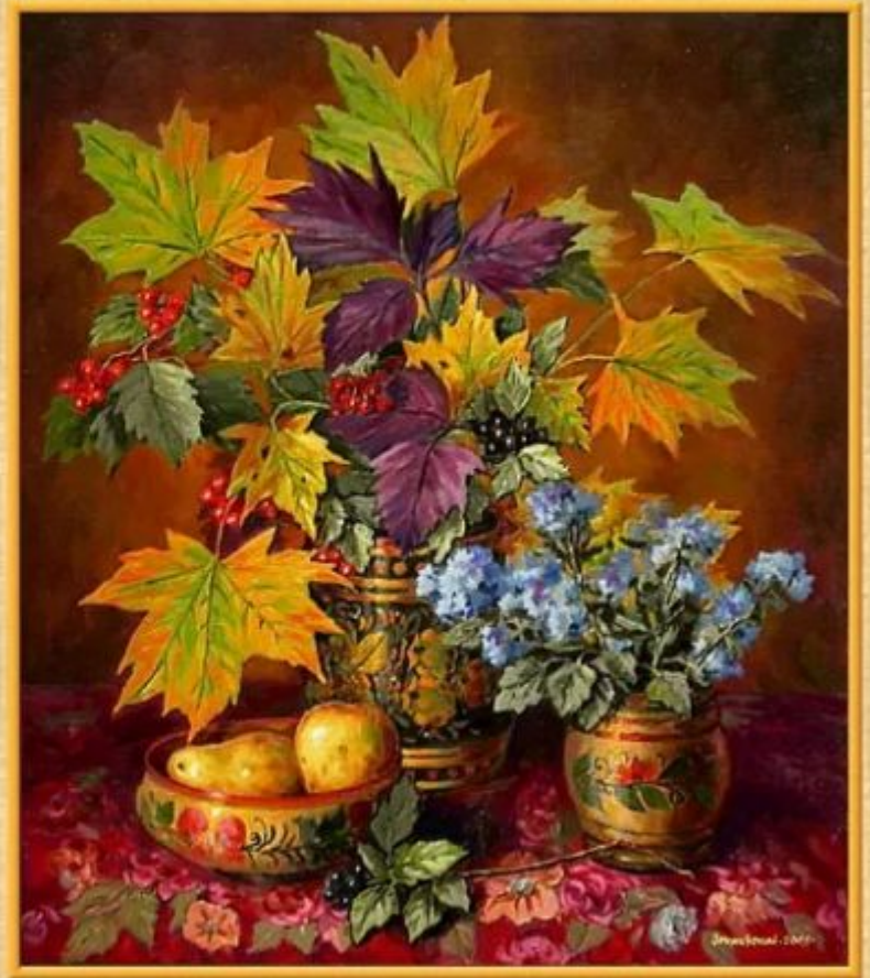
Пример сюжетно-тематического натюрморта. Тема: осень