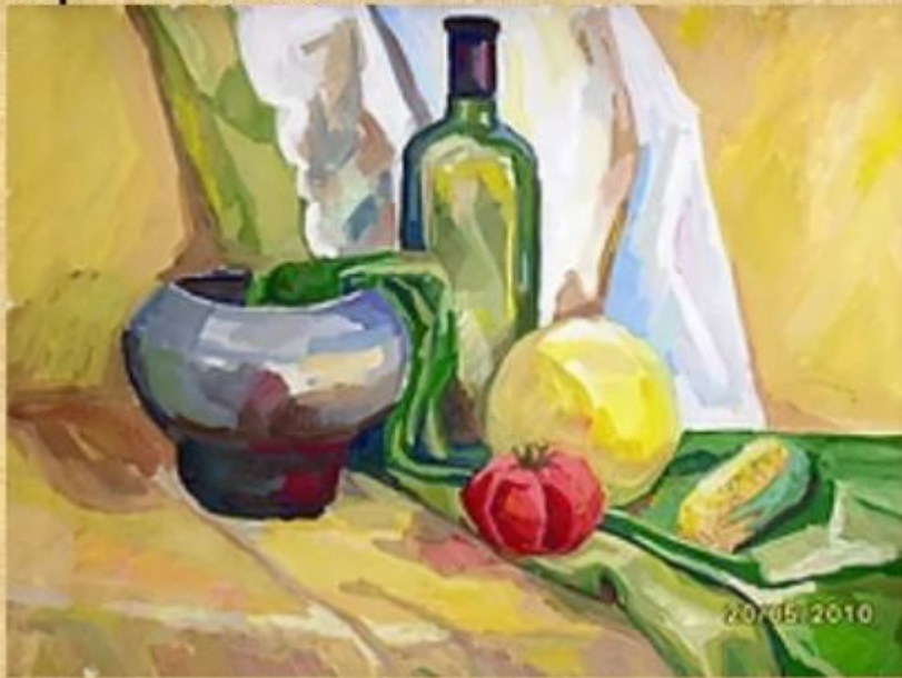
Пример учебной работы в зеленых тонах