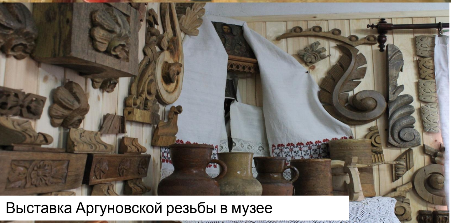
Выставка Аргуновской резьбы в музее