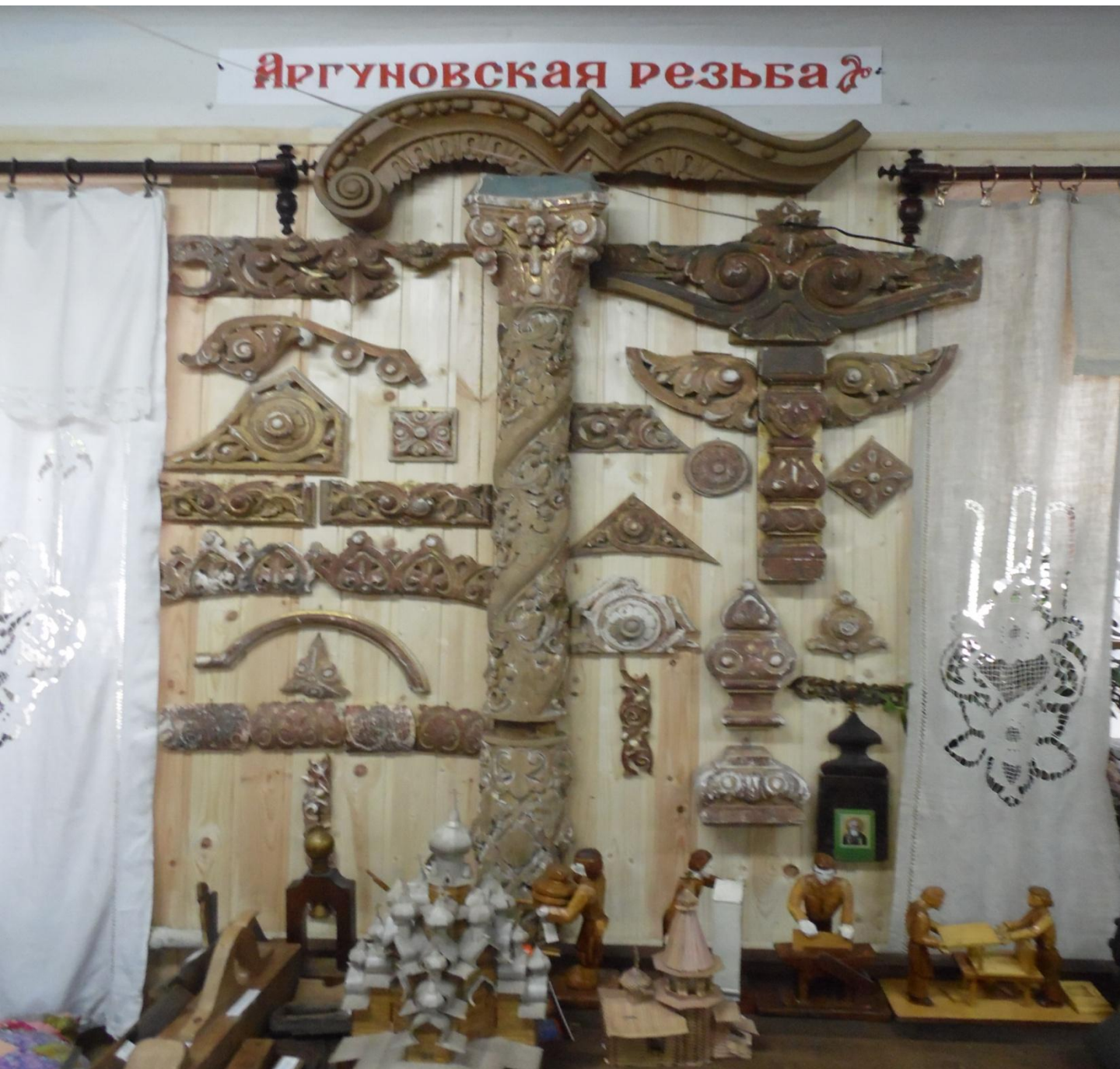
Выставка Аргуновской резьбы в музее

В XIX веке жизнь города оживляла проходившая через него большая торговая дорога — Стромынка, связывавшая Москву с текстильным краем. Жители города и окрестных деревень занимались преимущественно шёлкоткачеством и столярно-плотничным делом. Особенно славились местные резчики по дереву, известные в Москве как «аргуны» (от названия села Аргуново).