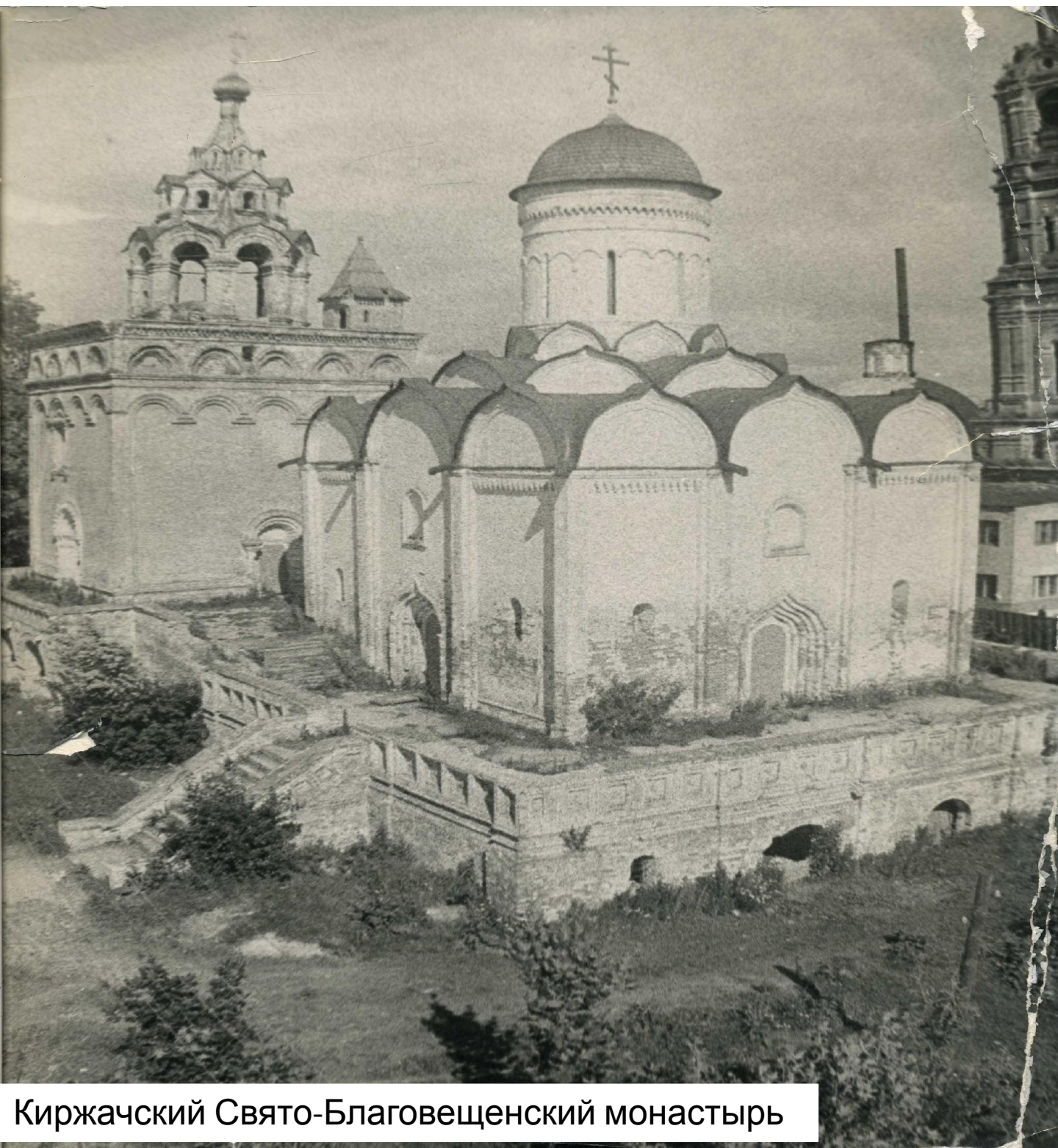
Киржачский Свято-Благовещенский монастырь

Впервые упоминается в 1332 году в духовной грамоте Ивана Калиты. По другой версии Киржач возник в середине XIV века как слобода при основанном в 1358 году Сергием Радонежским Благовещенском монастыре.