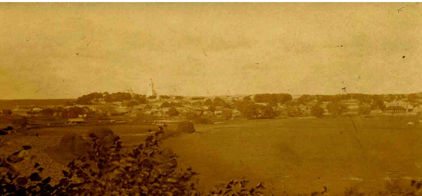
Вид с Селивановой Горы

В 1778 году по именному указу Екатерины II были учреждены губернии, в том числе Владимирская губерния в составе 14 уездов. При этом уездные центры были объявлены городами. По этой реформе центром Киржачского уезда стал город Киржач, в состав которого были включены Слободка около монастыря и село Селиванова гора. 6 августа 1781 года был утверждён герб Киржача. В 1788 году принят генеральный план застройки города.