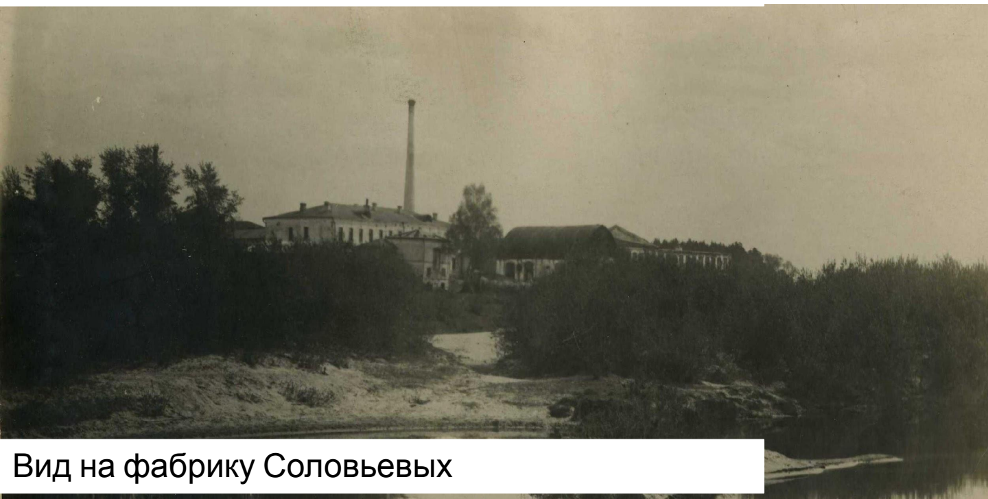
Вид на фабрику Соловьёвых