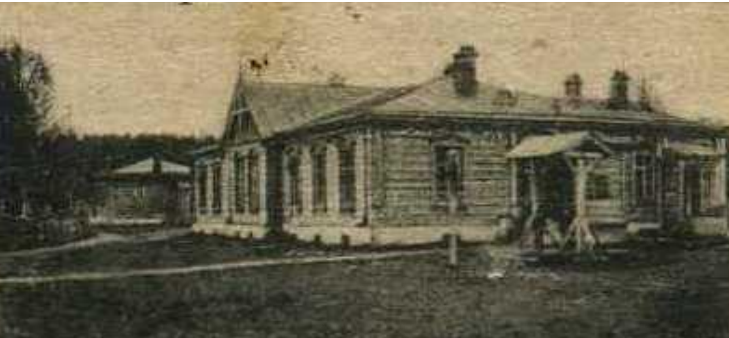
Киржачская учительская семинария

На средства Соловьевых в Киржаче были построены первая в губернии учительская семинария, женское двухклассное училище (ныне средняя школа № 2), Всехсвятская церковь и другие определившие облик города строения.