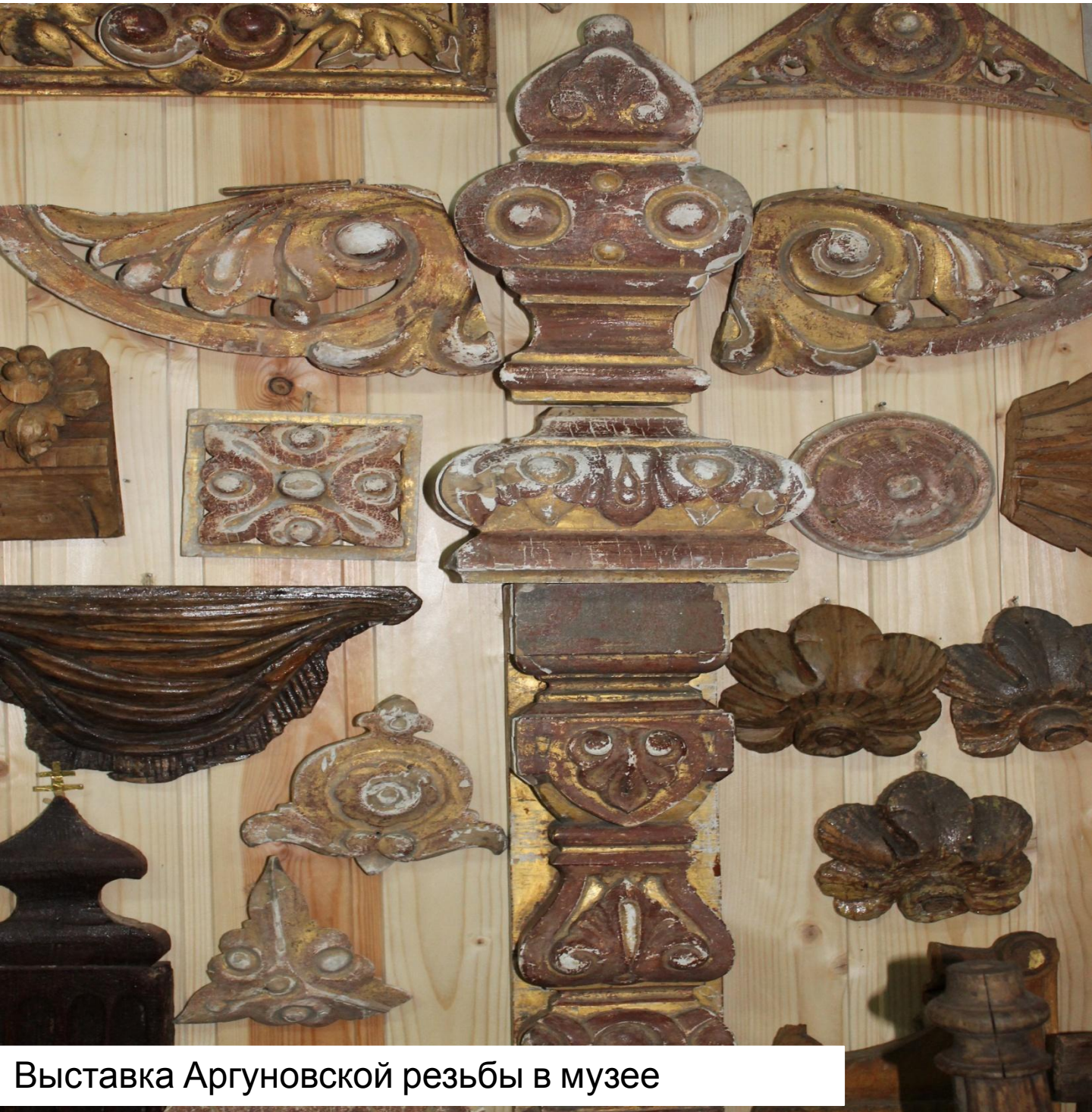
Выставка Аргуновской резьбы в музее

В XIX веке жизнь города оживляла проходившая через него большая торговая дорога — Стромынка, связывавшая Москву с текстильным краем. Жители города и окрестных деревень занимались преимущественно шёлкоткачеством и столярно-плотничным делом. Особенно славились местные резчики по дереву, известные в Москве как «аргуны» (от названия села Аргуново).