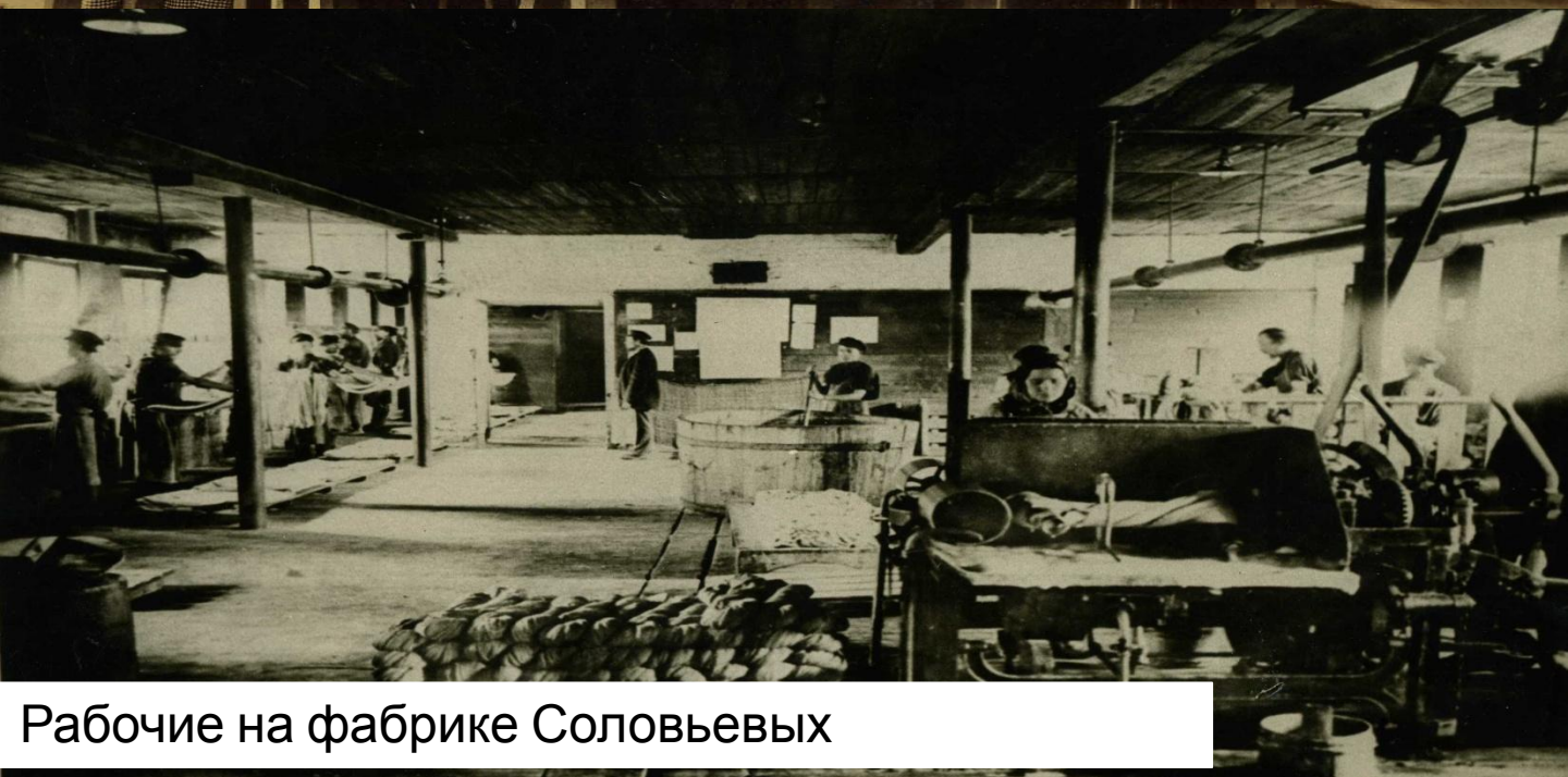
Рабочие на фабрике Соловьёвых