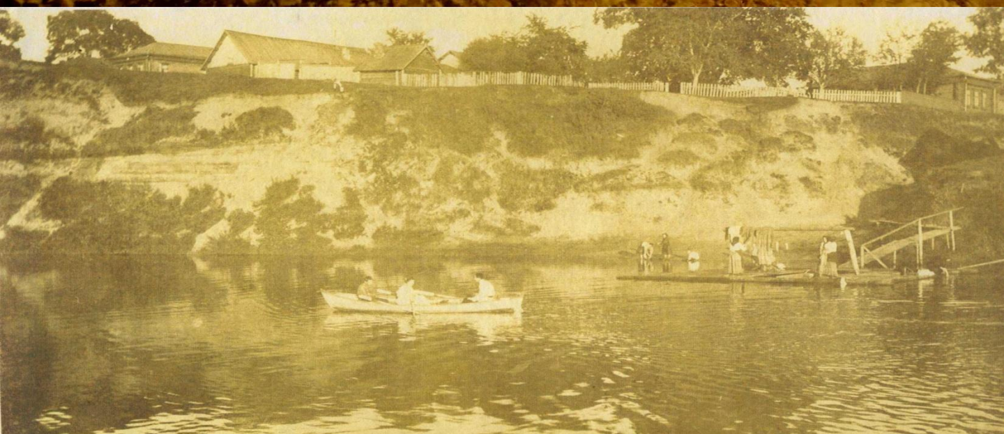
Река Киржач на Селиванове