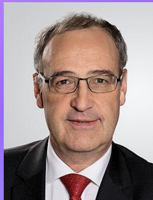
Ги Пармелен(2020) ВИЦЕ-ПРЕЗИДЕНТ