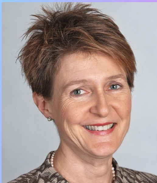
Симонетта Соммаруга(2020) ПРЕЗИДЕНТ