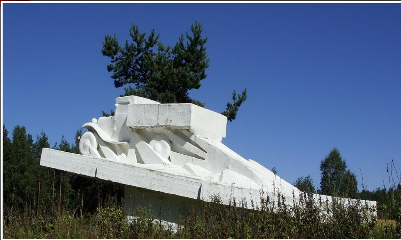
Памятник «Неизвестному шофёру», воевавшему на легендарной полutorке. Установлен в Дусьево (деревня Кировского района Ленинградской области).