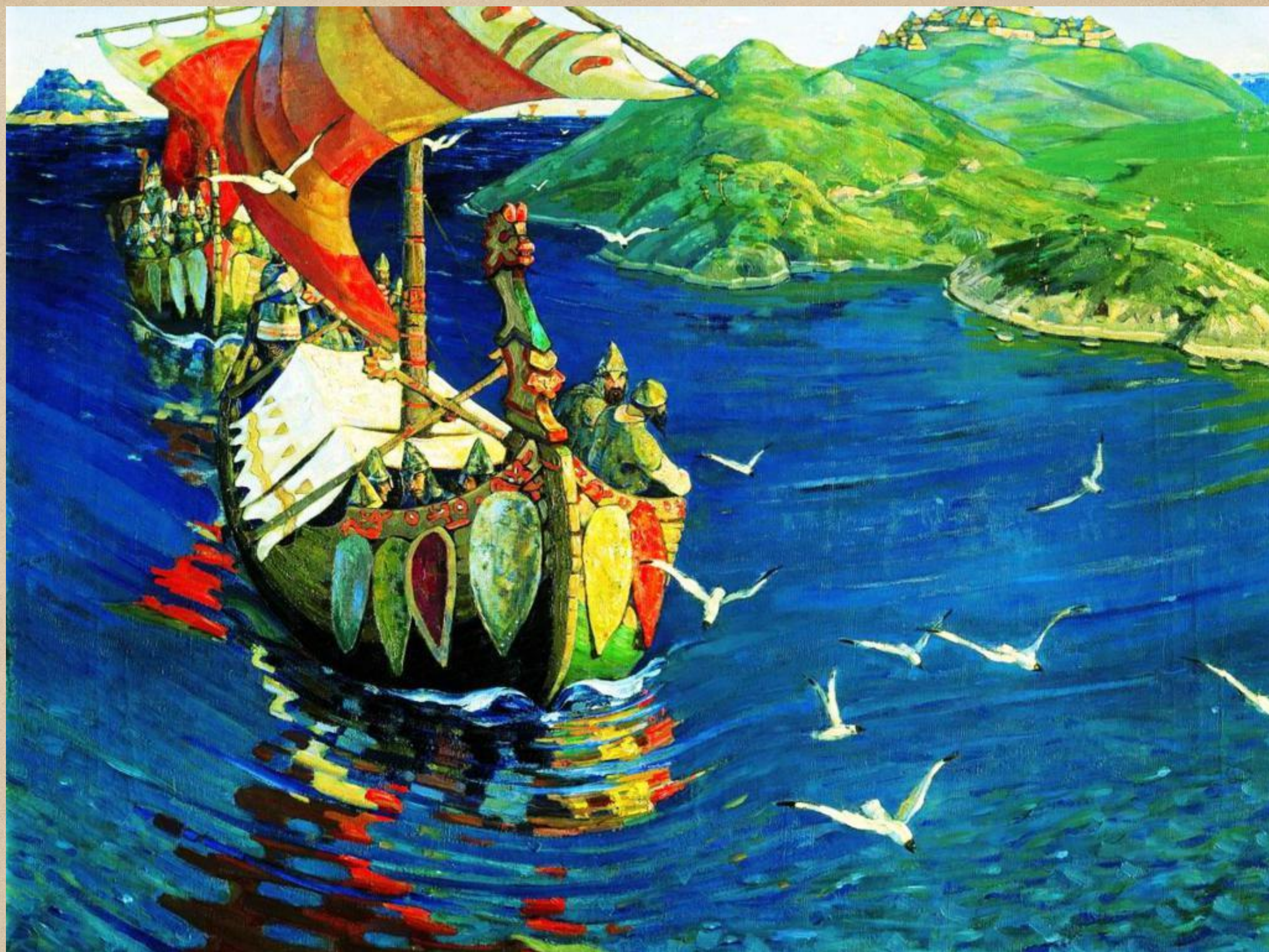
Заморские гости. Художник Н. К. Рерих