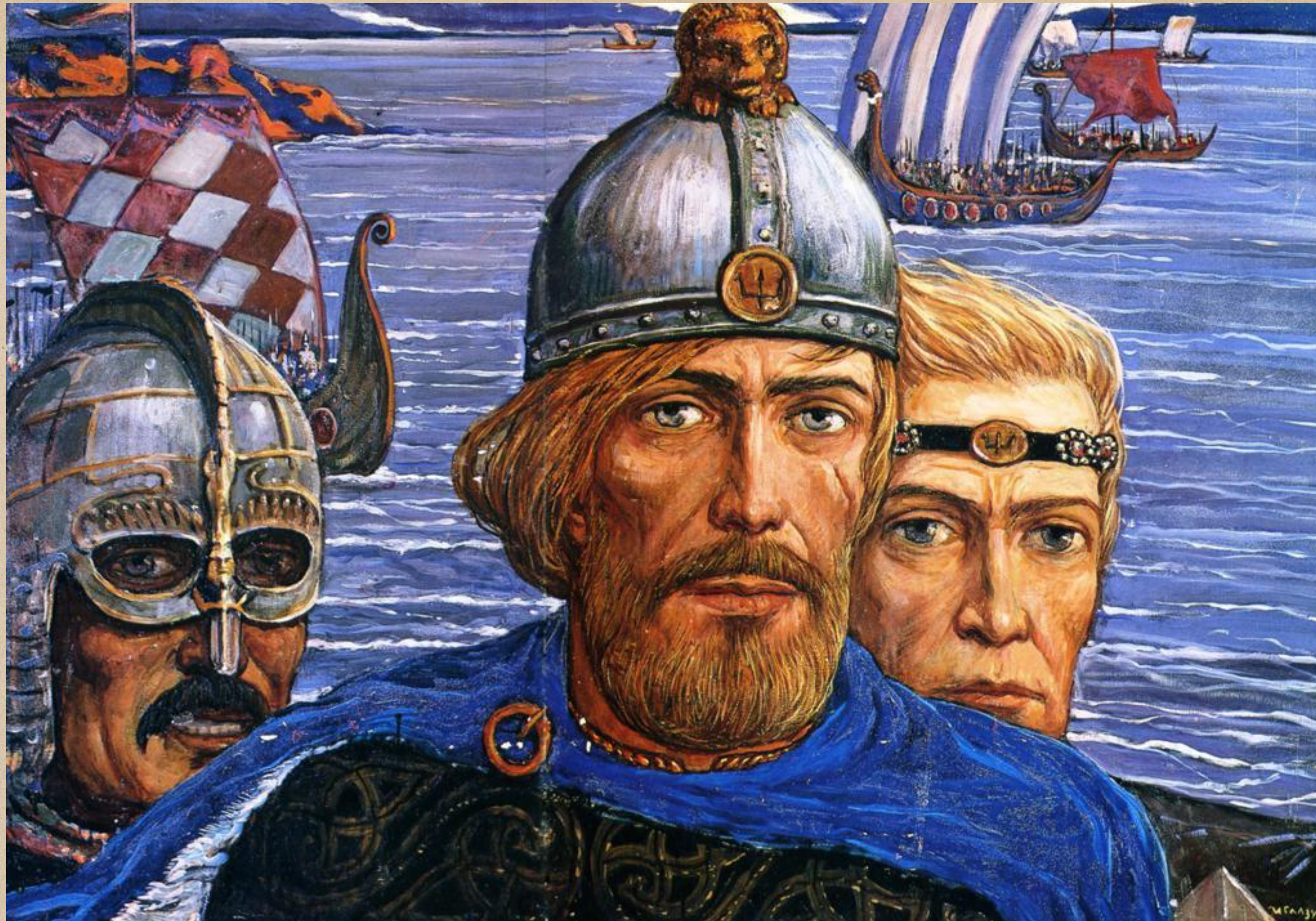
Рюрик, Трувор, Синеус. Художник И. С. Глазунов