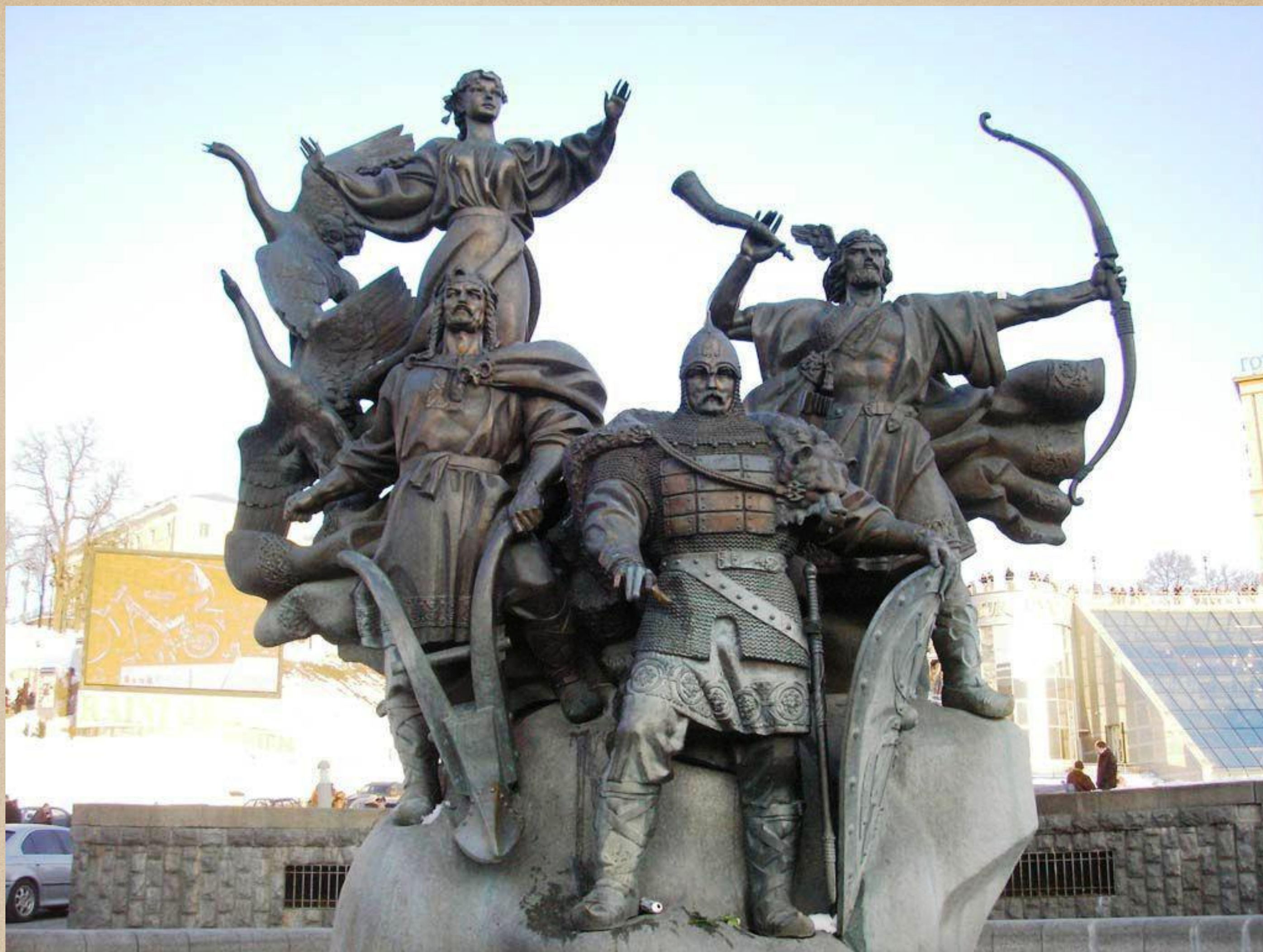
Памятник основателям Киева. Скульптор А. Куц. Киев