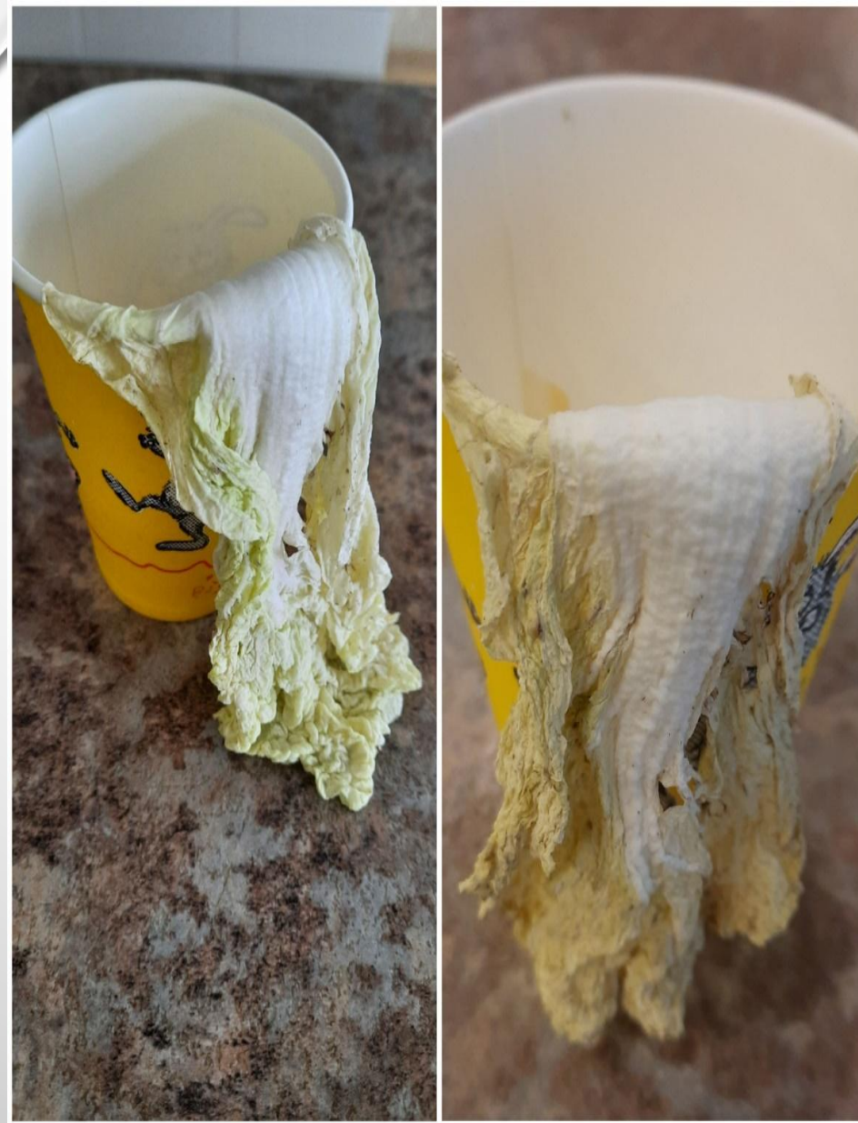
Лист 4 дня «пьет» только молоко. Лист неделю «пьет» только молоко