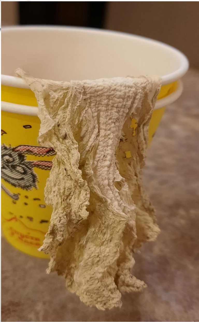
Через 2 недели нахождения листа капусты в молоке