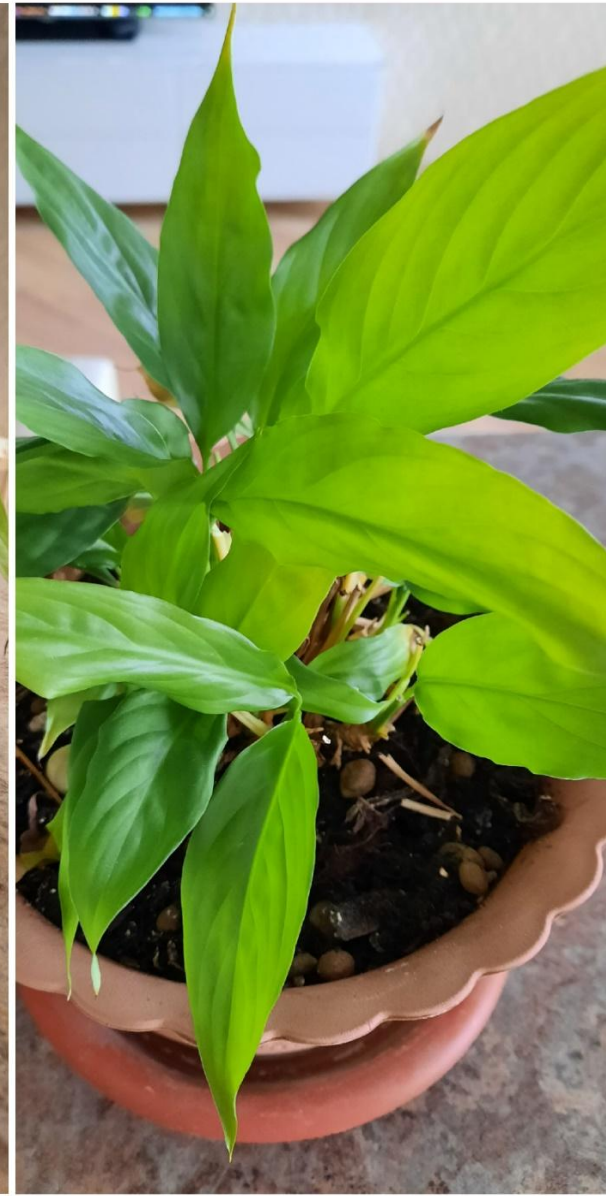
10 дней без полива и опрыскивания Через 1 день после возобновления полива