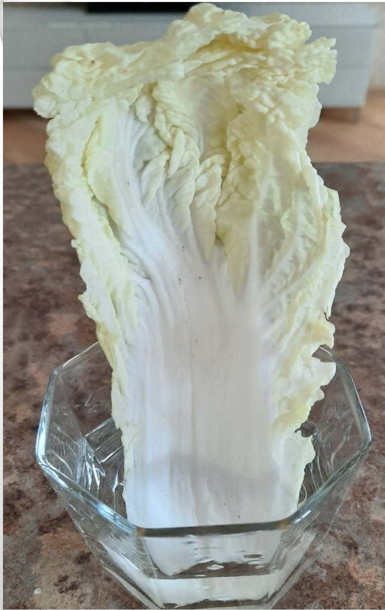
Лист в воде с добавлением капли молока