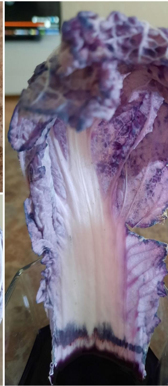
Лист пекинской капусты полностью изменил цвет, «напился» воды с добавлением пищевого красителя