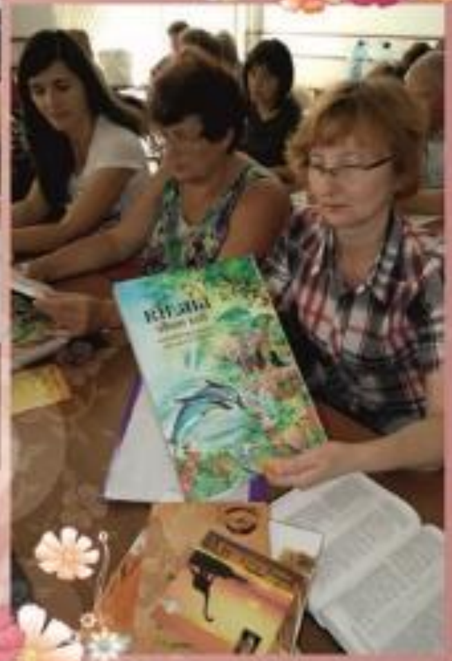
Учителі з подарунками