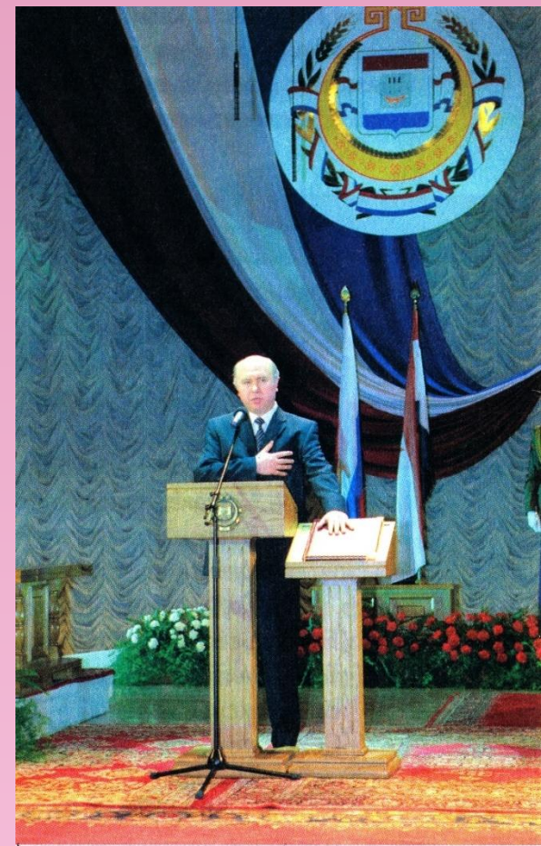
Торжественное вступление в должность Главы Республики Мордовия

Высший исполнительный орган власти – Правительство РМ