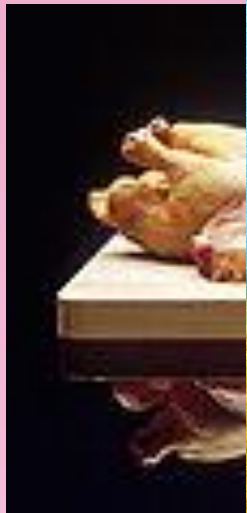
Новая продук ОАО «Русхимл

Современная сельскохозяйственная техника на полях республики