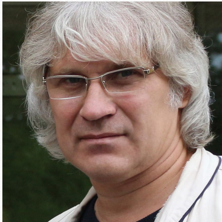
Юрий Душин Российский режиссёр и актёр