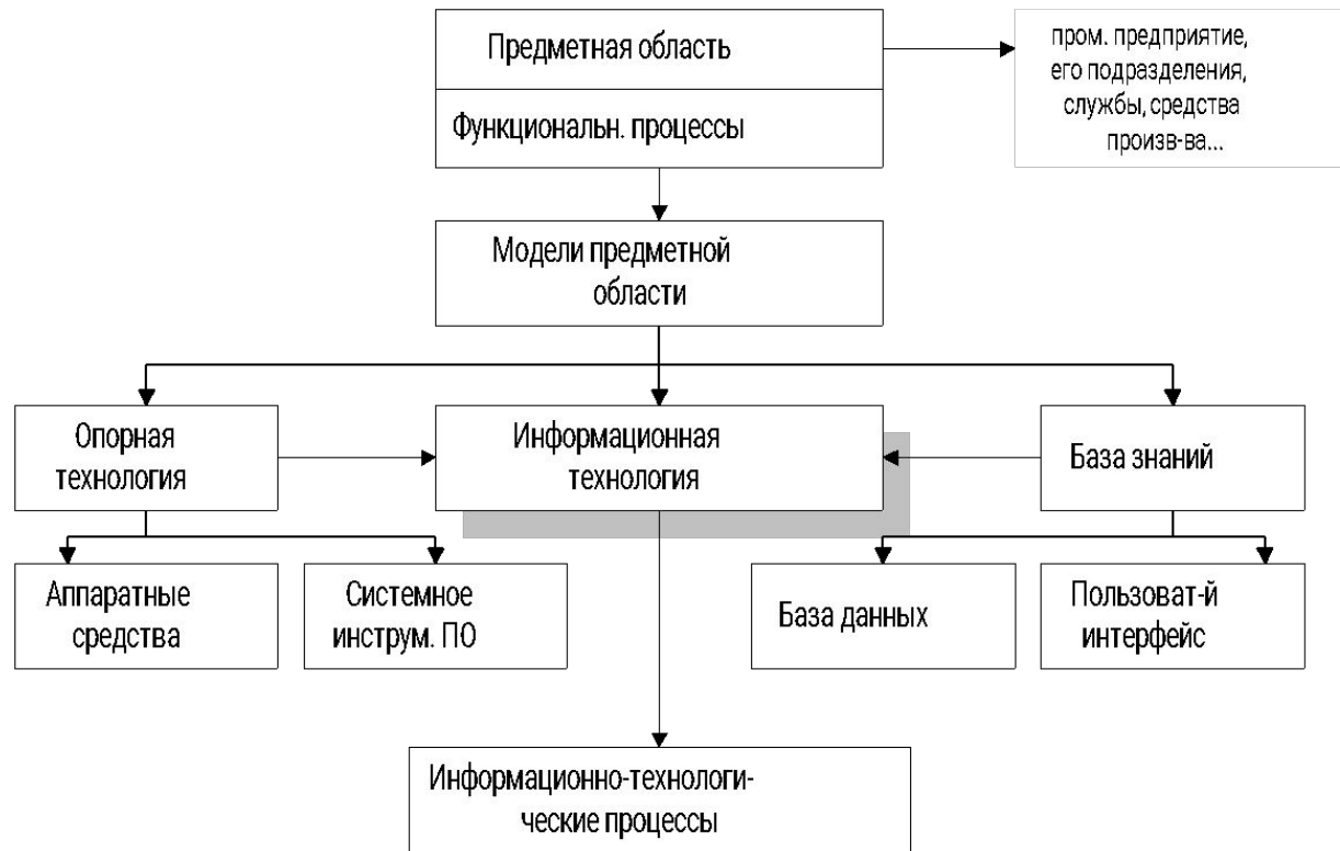
Рис. 1. 1. Структура информационной технологии.