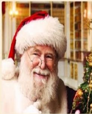
«Фазер Кристмас» (Father Christmas)