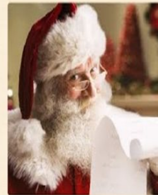
«Санта-Клаус» (Santa Claus)