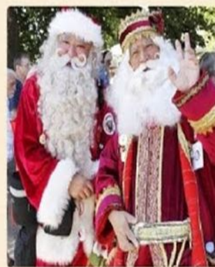
«Шань Дань Лаожен» (圣诞老人)