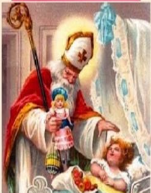
«Святой Николай» (Святий Миколай)