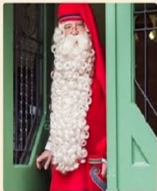
«Святой Николай» (Święty Mikołaj)