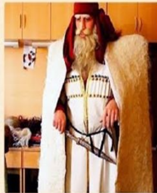
«Товлис Баба» (თოვლის ბაბუა)