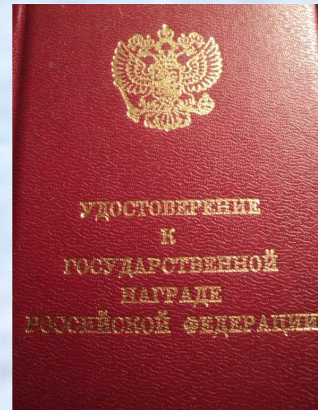
Награжден орденом мужества посмертно