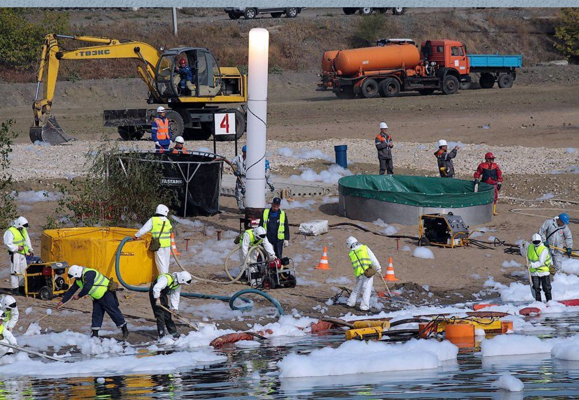
Очистка поверхности от разлива нефти