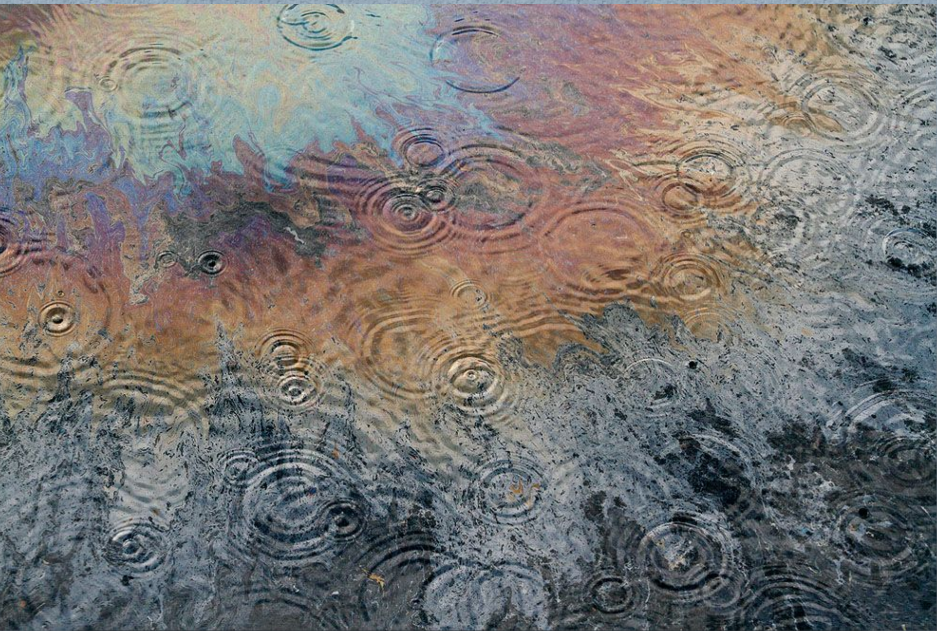
Нефтяные разводы в лужах