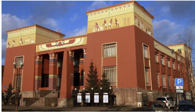
Детский познавательный туризм