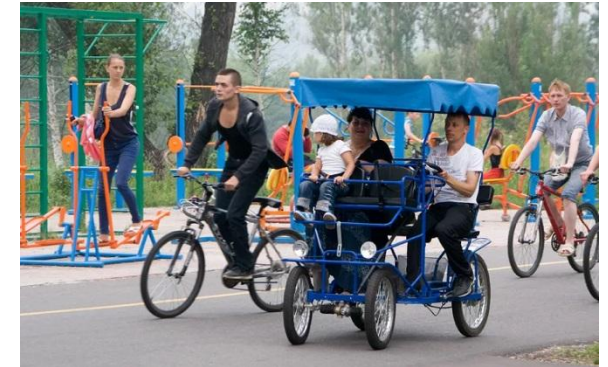
Детский активный туризм