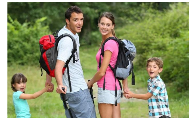
Детский и семейный туризм