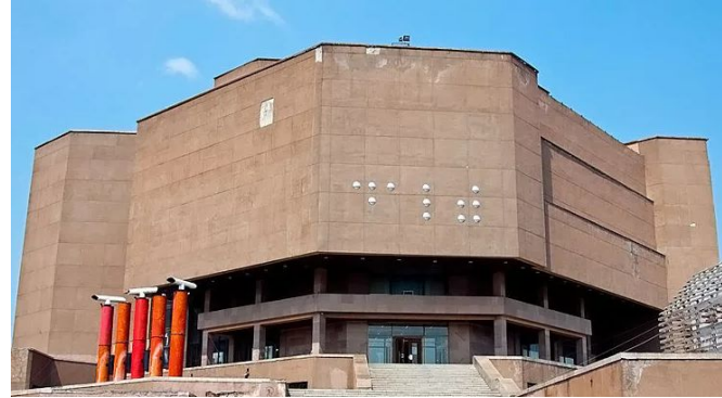
Детский культурно-познавательный туризм