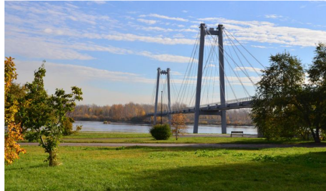
Детский экскурсионный туризм