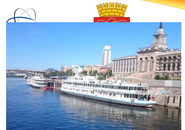
Детский водный туризм