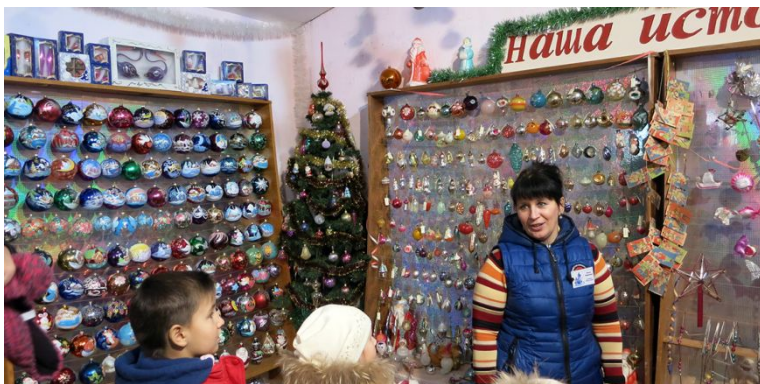
Детский образовательный туризм