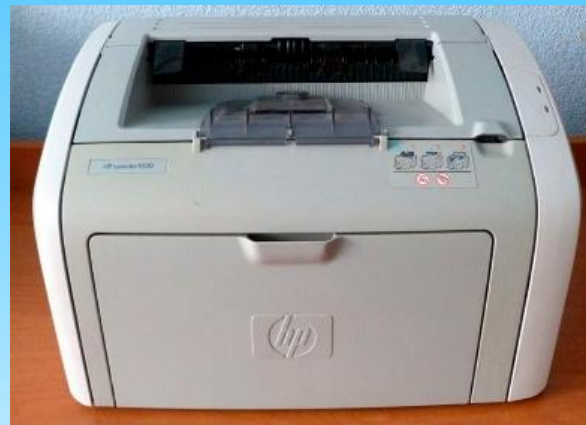
Лазерный принтер HP LaserJet 1020

Лазерный принтер HP LaserJet 1020 — принтер, предназначенный для домашней работы или для небольшого офиса со средней степенью загрузки. Обладает средней скоростью печати. Принтеры серии HP 1020 работают на довольно надежном картридже, который хорошо поддается заправке.