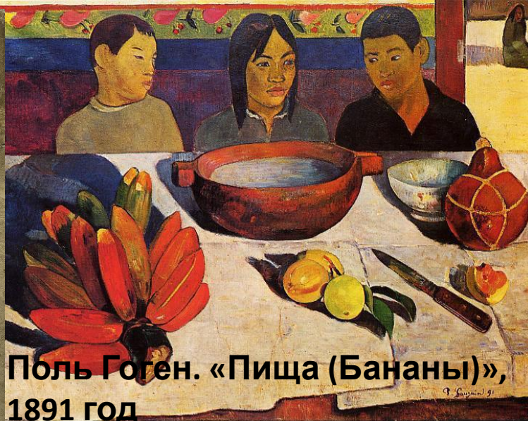
Поль Гоген. «Пища (Бананы)», 1891 год