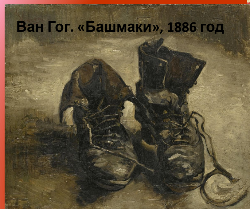
Ван Гог. «Башмаки», 1886 год