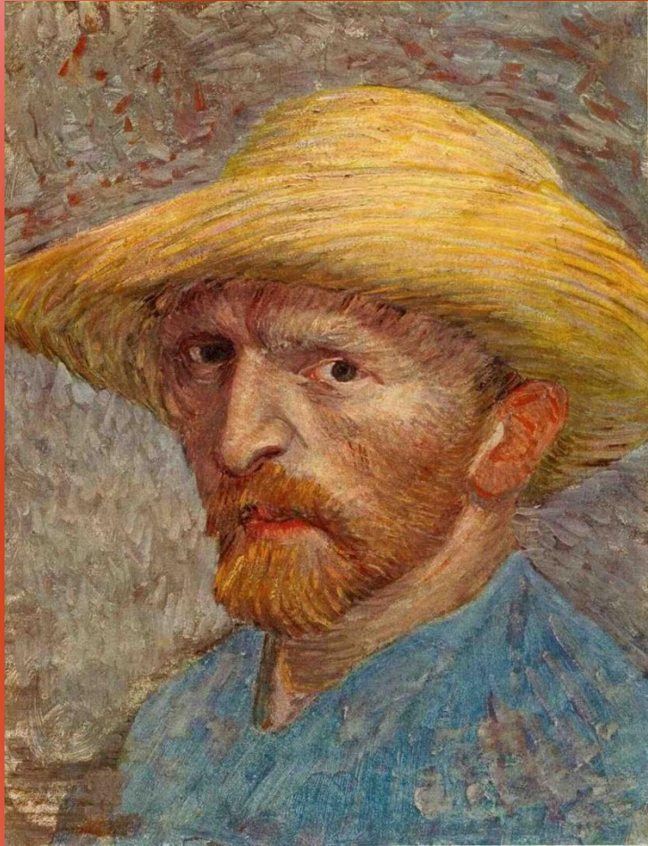
Автопортрет Винсента Ван Гога, 1887 год