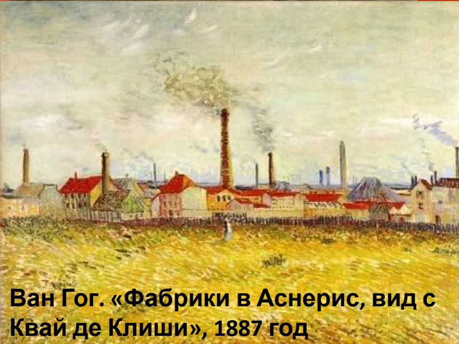
Ван Гог. «Фабрики в Аснерис, вид с Квай де Клиши», 1887 год