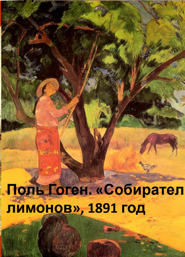
Поль Гоген. «Собиратель лимонов», 1891 год