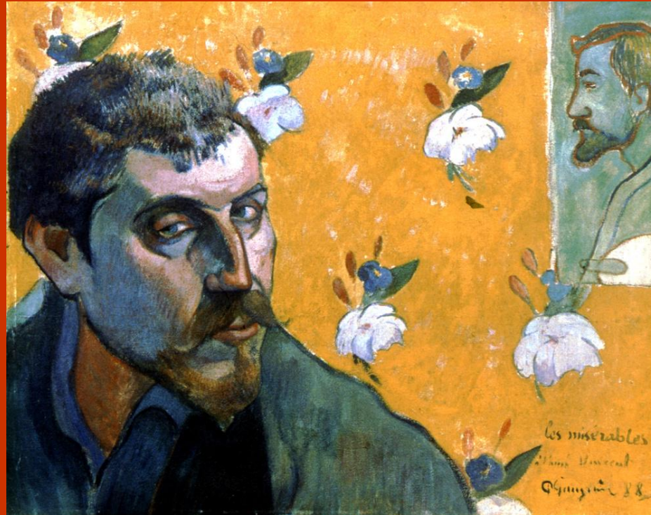
Поль Гоген. Автопортрет, посвященный Винсенту Ван Гогу (Отверженные), 1888 год