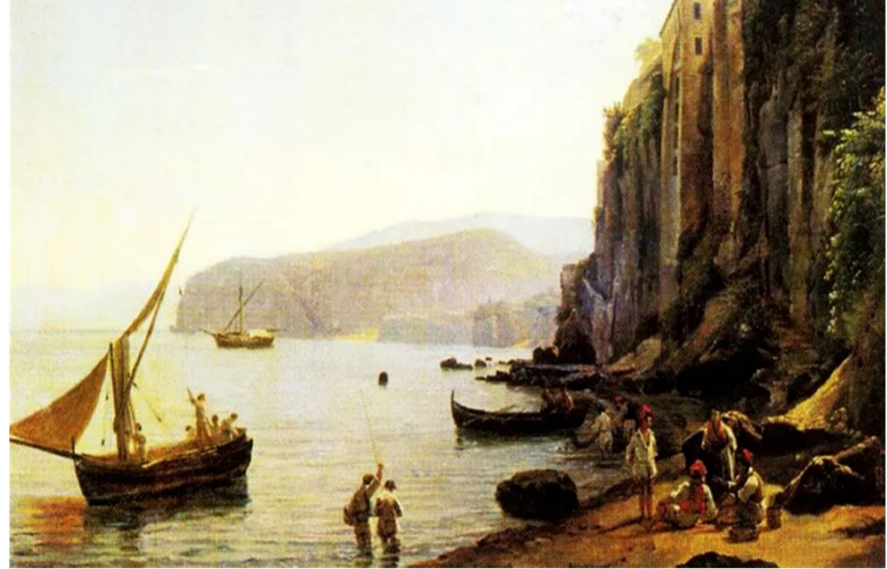
“Вид Сорренто близ Неаполя” Сильвестр Феодосиевич Щедрин (1825 год).