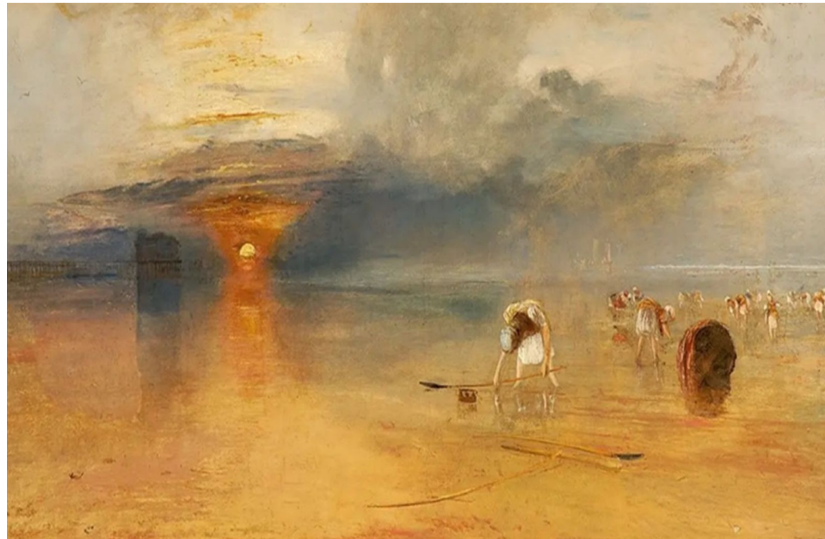
“Побережье Кале в отлив. Торговки, собирающие наживку для рыбной ловли” (1830 год). Джозеф Уильям Тёрнер