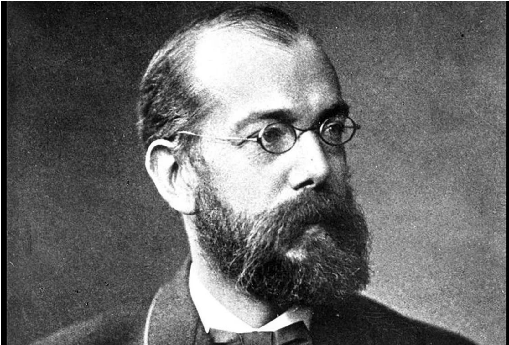
Роберт Кох (1843-1910)