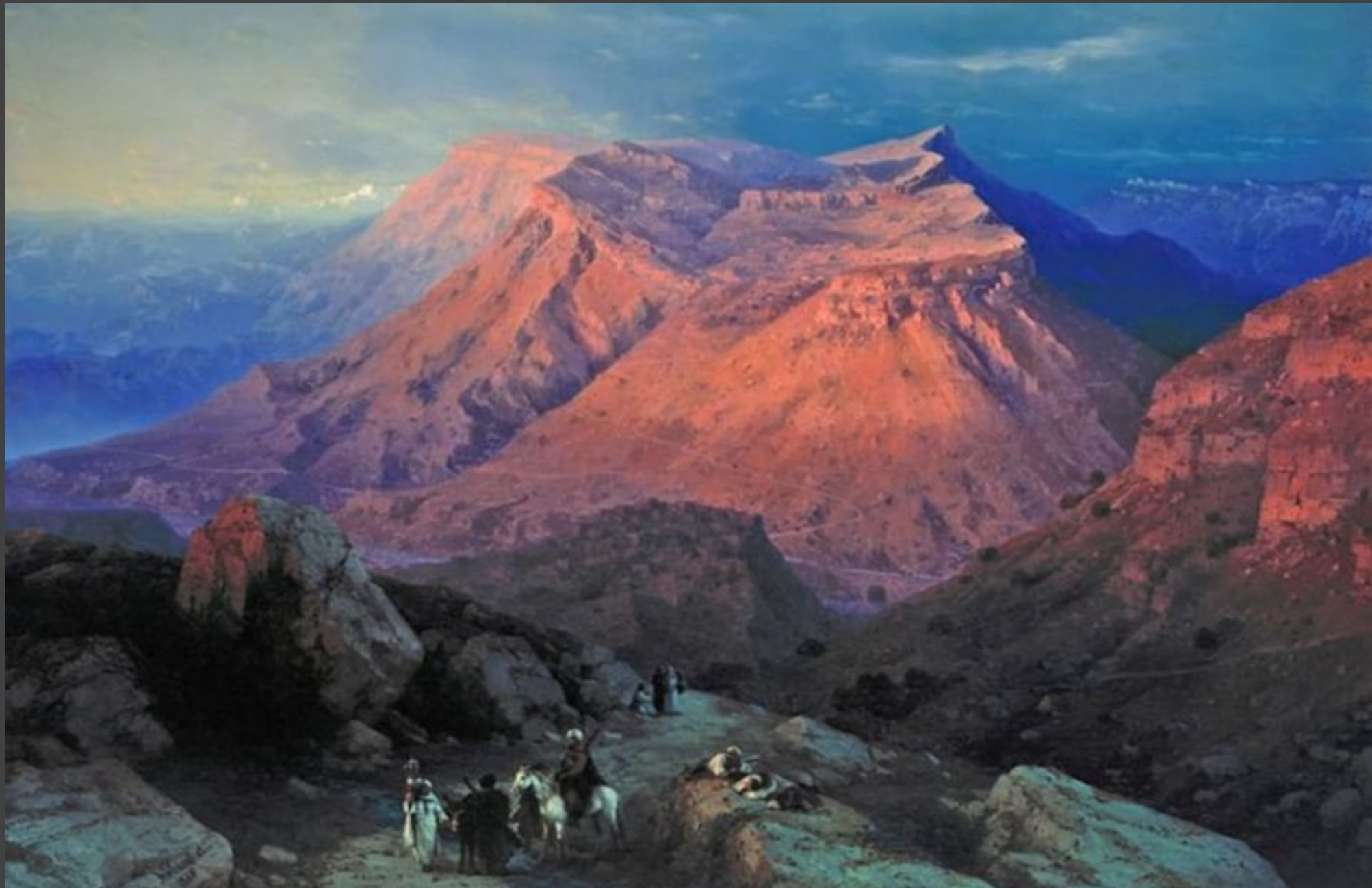
“Аул Гуниб в Дагестане” (1869 год).