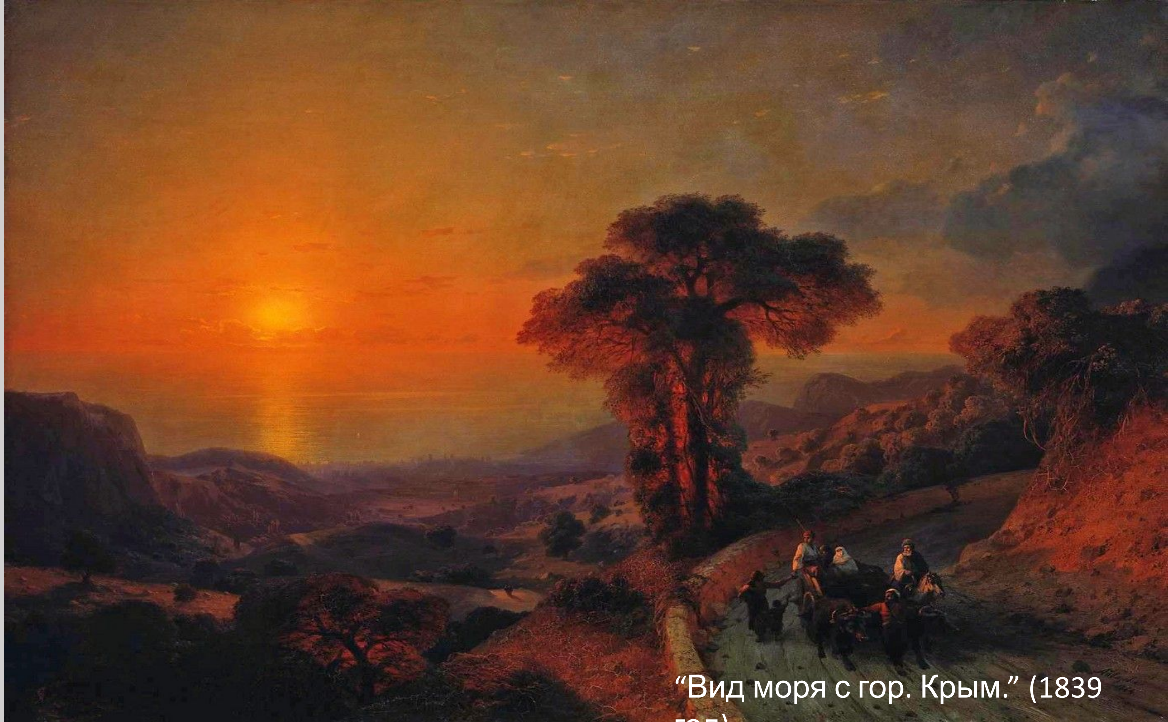
“Вид моря с гор. Крым.” (1839