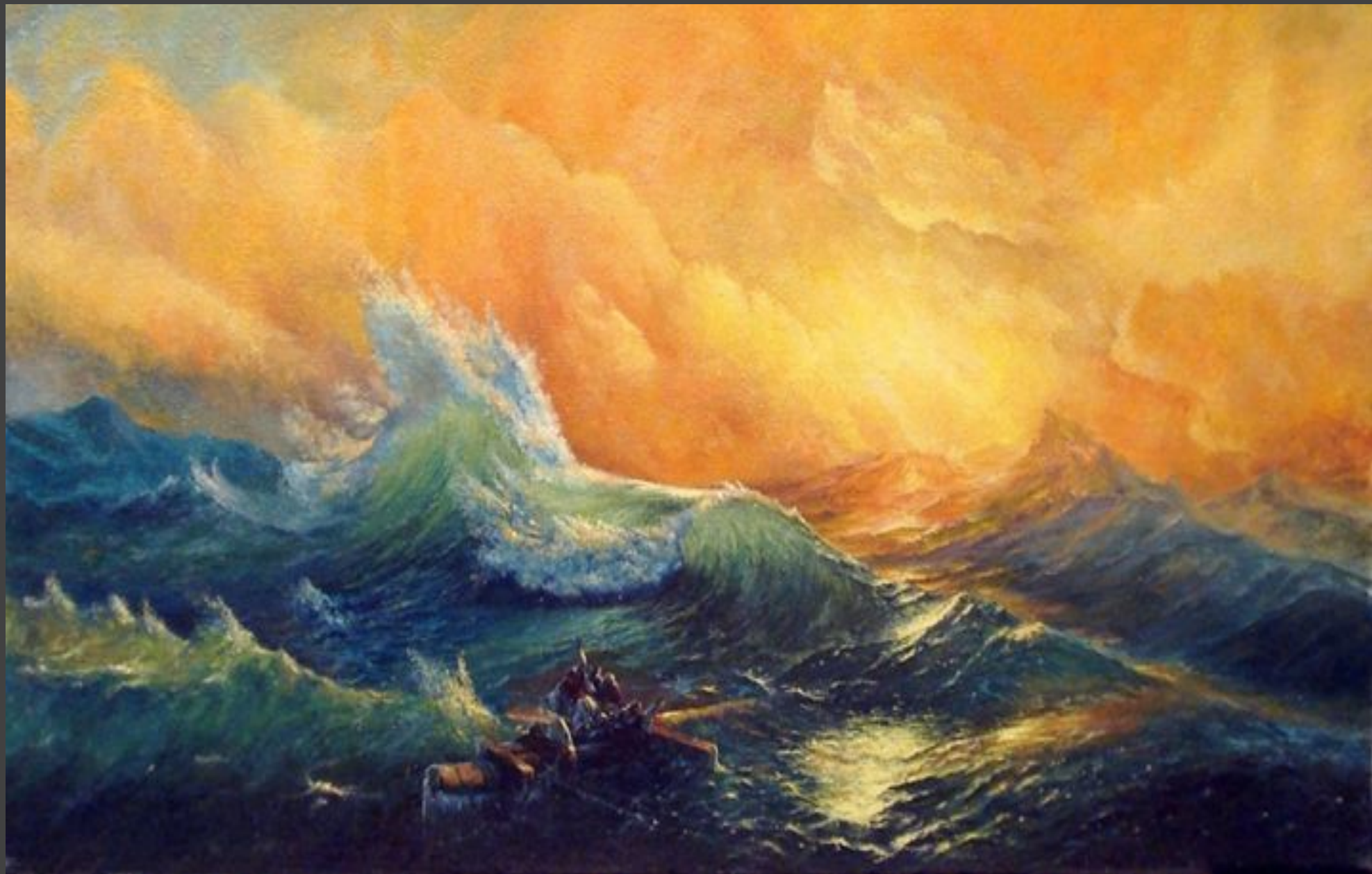
“Девятый вал” (1850 год).