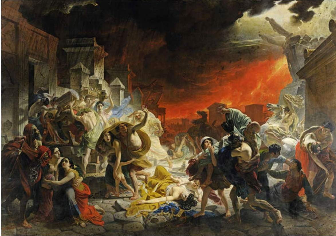
“Последний день Помпеи” (1830-е года).