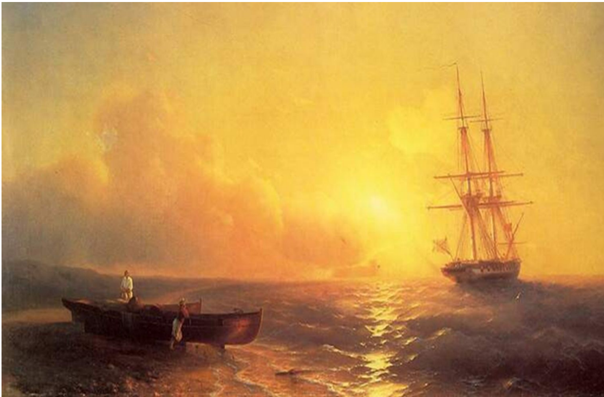
“Рыбаки на берегу моря” Иван Константинович Айвазовский (1852 год).