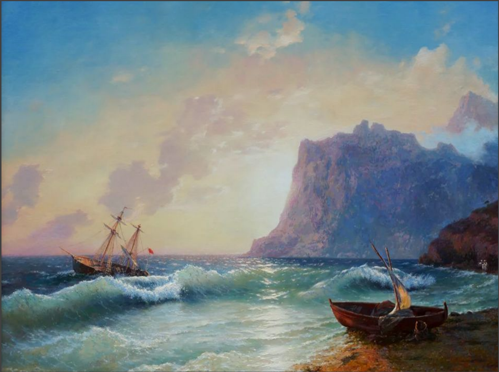
“Море. Коктебельская бухта.” (1853 год).