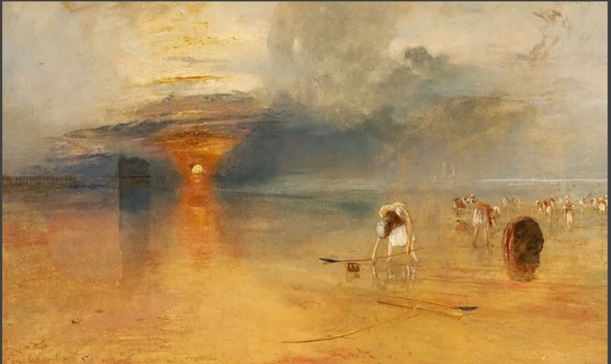
“Побережье Кале в отлив. Торговки, собирающие наживку для рыбной ловли” (1830 год).