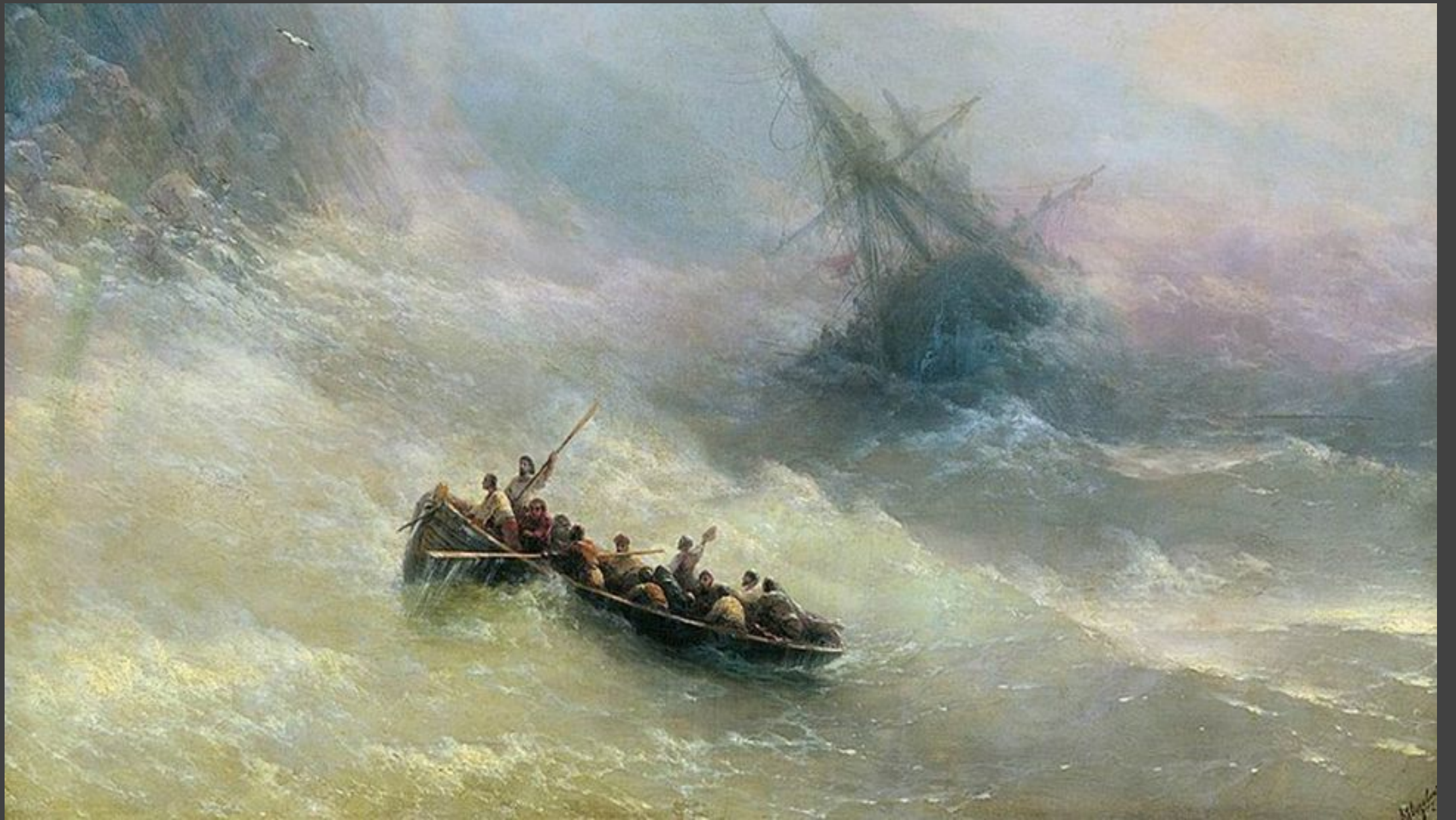
“Радуга” (1873 год)