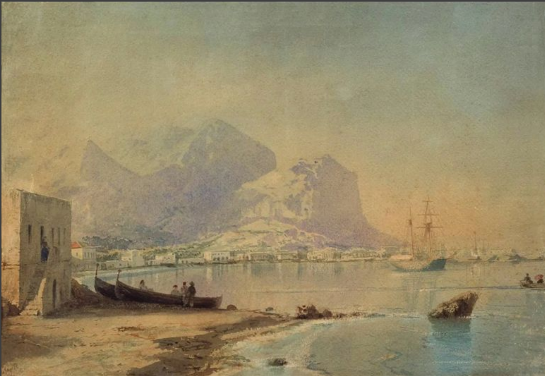
“В гавани” Иван Константинович Айвазовский (1842 год).