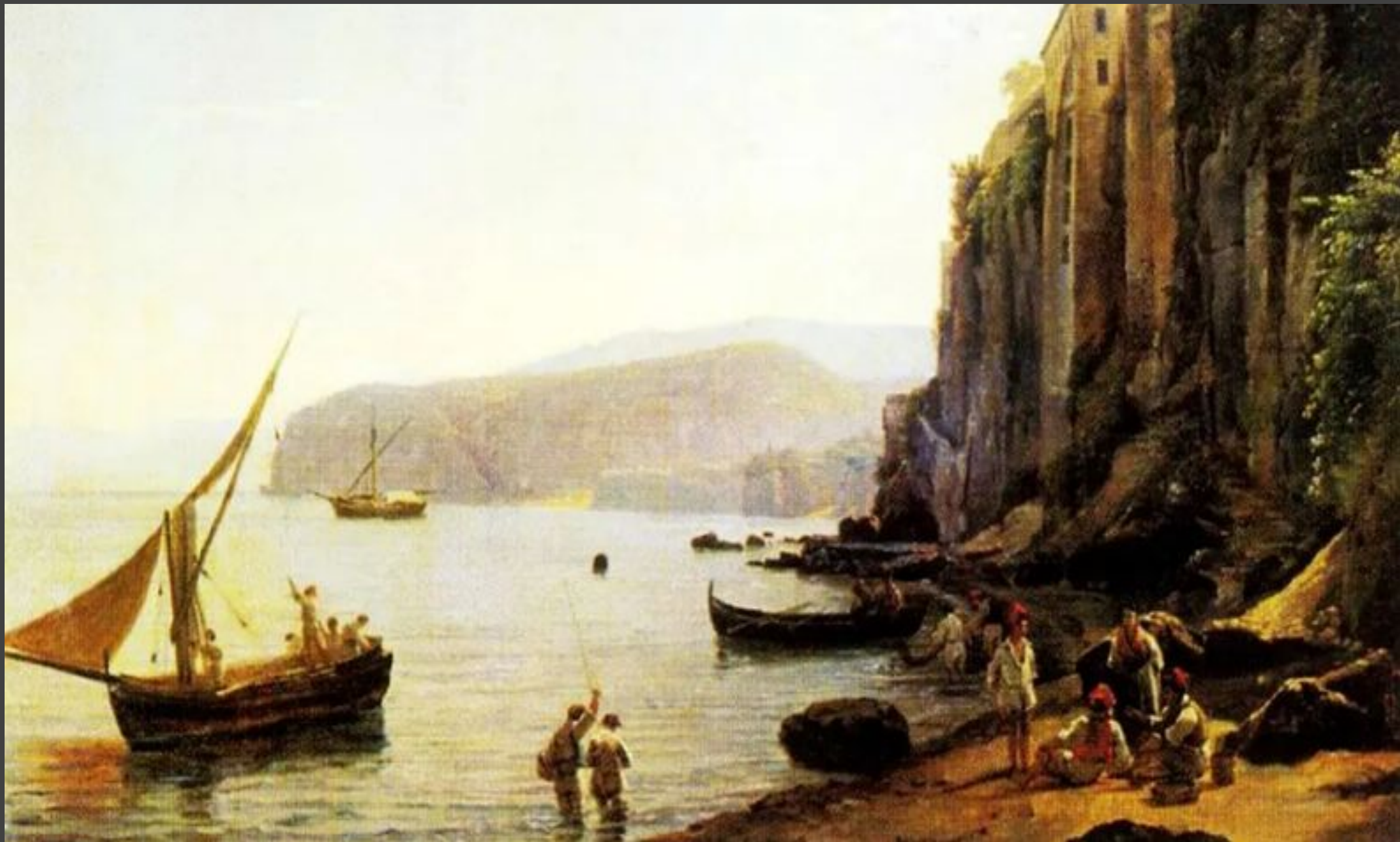
“Вид Сорренто близ Неаполя” Сильвестр Феодосиевич Щедрин (1825 год).