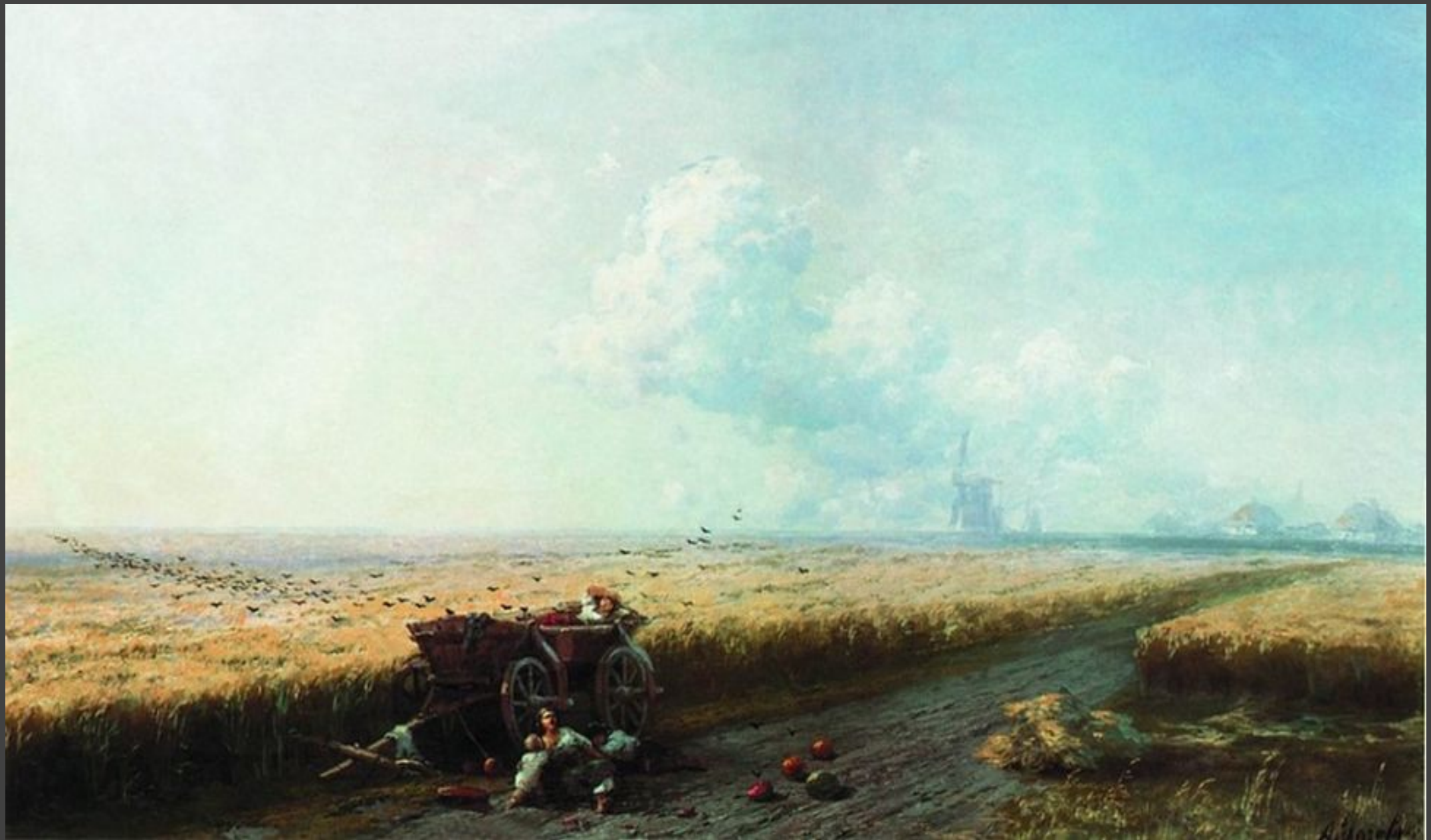
“Во время жатвы” (1883 год).