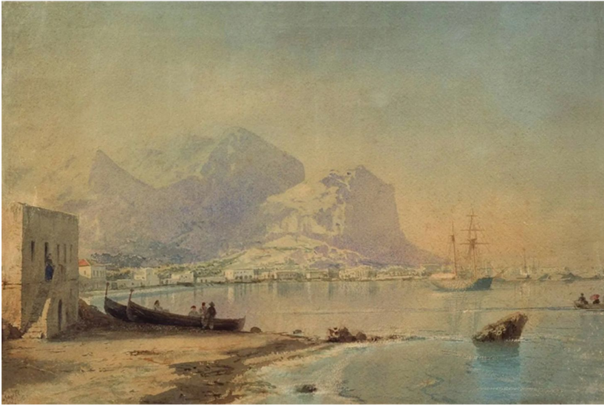
“В гавани” Иван Константинович Айвазовский (1842 год).