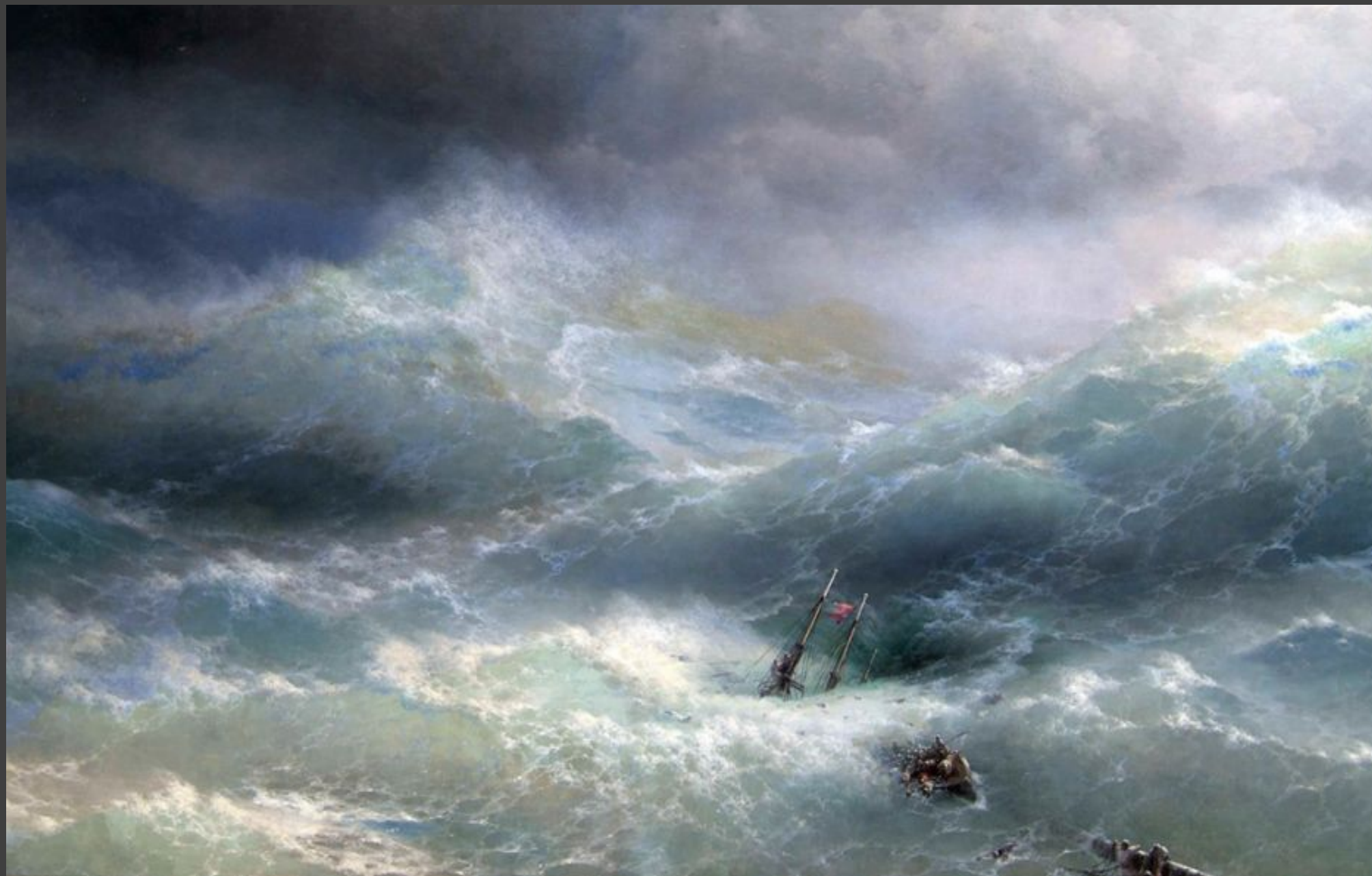
“волна Айвазовского” (1889 год)