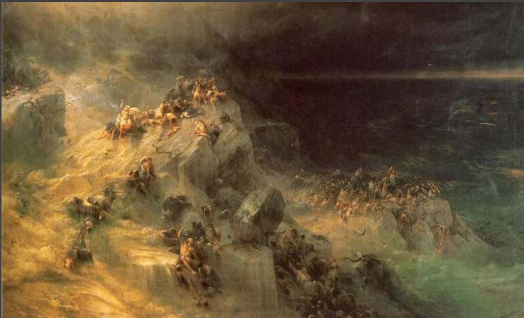
“Всемирный потоп” Иван Константинович Айвазовский (1864 год).