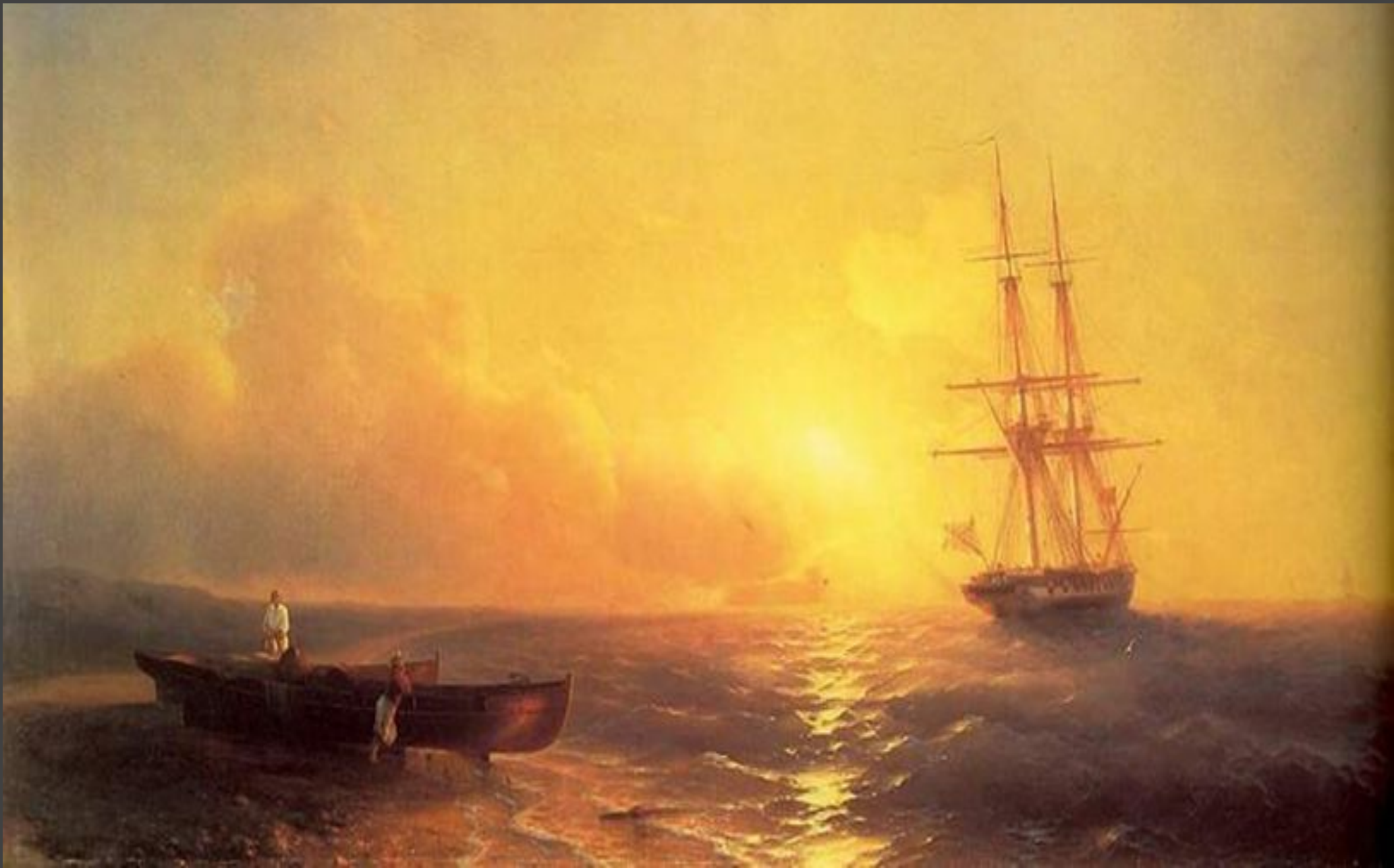
“Рыбаки на берегу моря” Иван Константинович Айвазовский (1852 год).