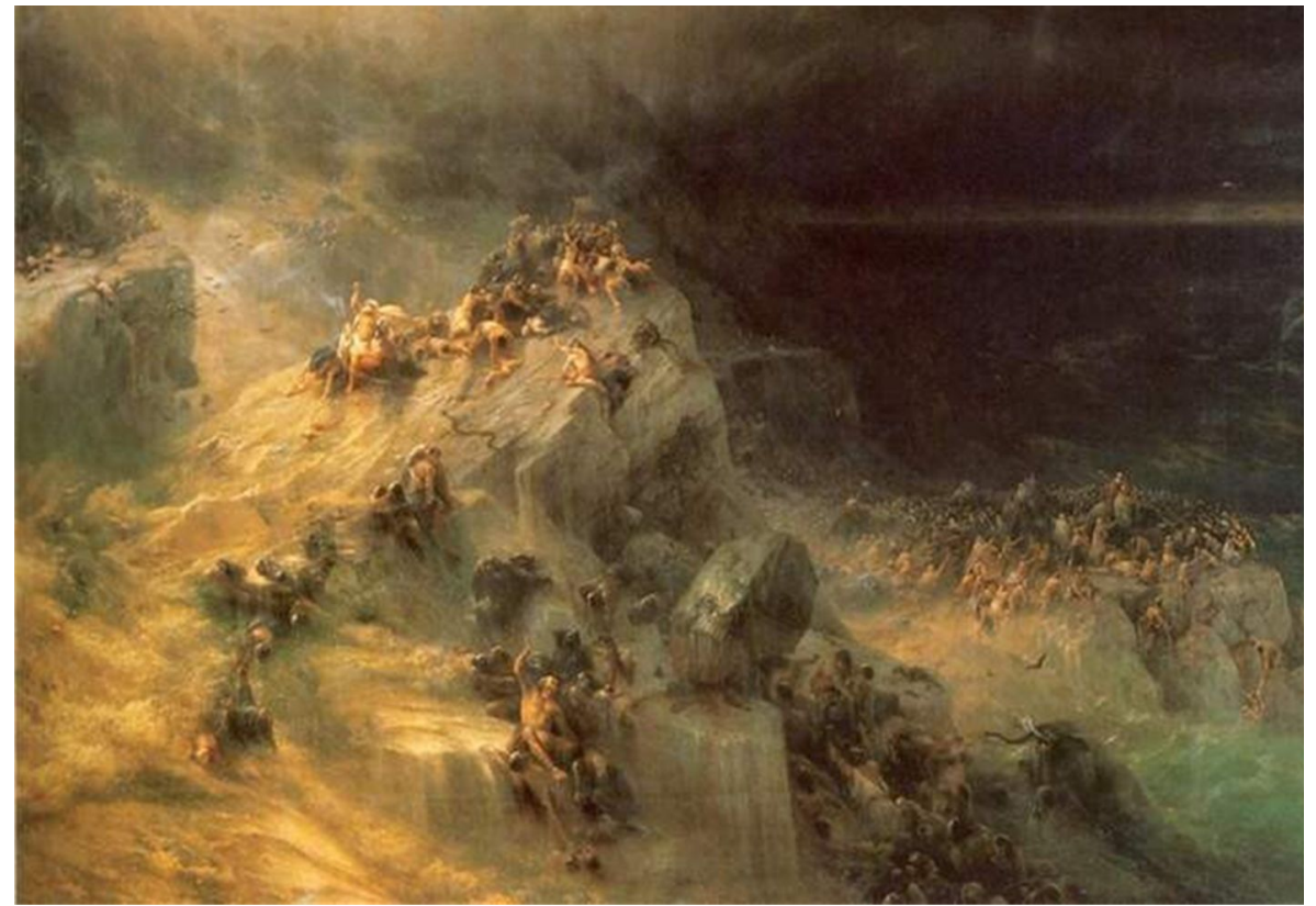
“Всемирный потоп” Иван Константинович Айвазовский (1864 год).